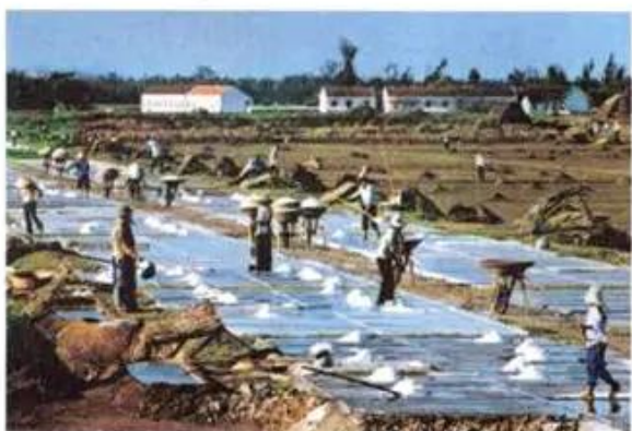
Hình 7. Cảnh đồng muối