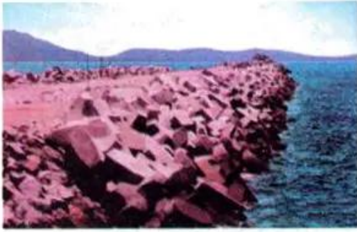
Hình 12. Đê chắn sóng ở khu cảng Dung Quất

Tại tỉnh Quảng Ngãi đang hình thành khu kinh tế Dung Quất. Ở đây sẽ có nhà máy lọc dầu lớn đầu tiên của Việt Nam.