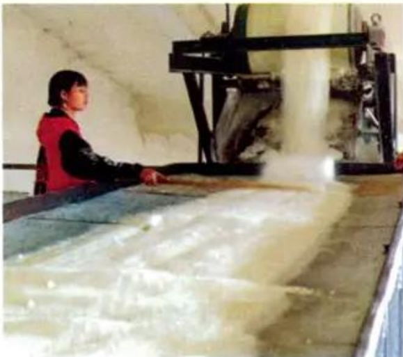
d) Sản xuất đường kết tinh