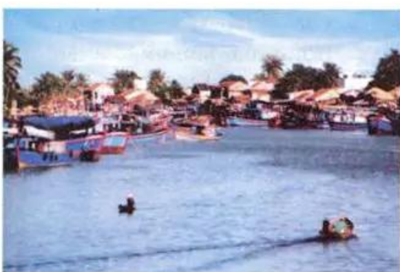
Hình 8. Làng chài