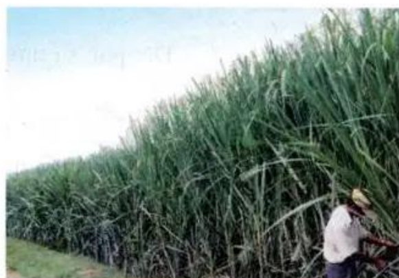
Hình 4. Cảnh đồng mía