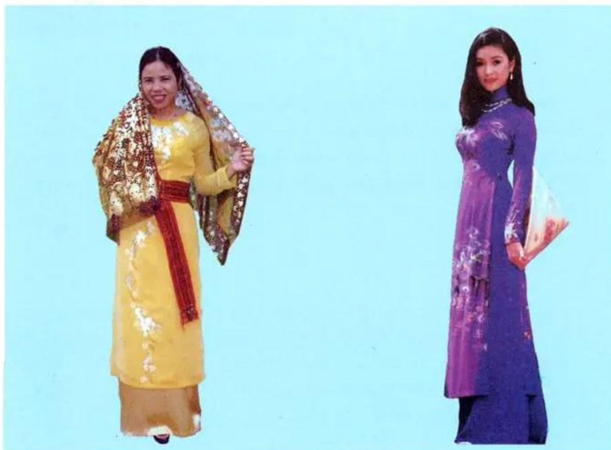
Hình 1. Trang phục của phụ nữ Chăm

– Quan sát hình 1 và 2, nhận xét trang phục của phụ nữ Chăm, phụ nữ Kinh.