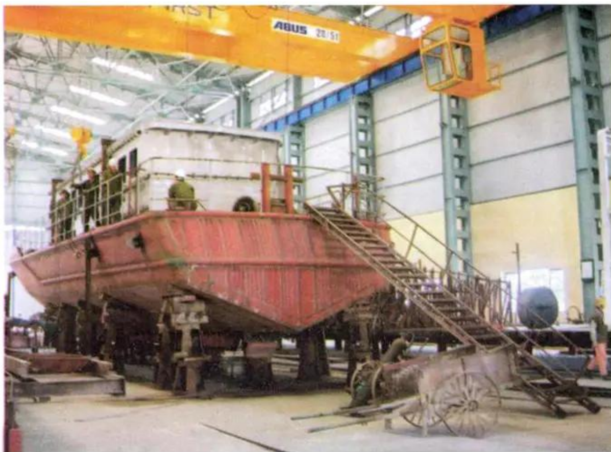
Hình 10. Xưởng sửa chữa tàu thuyền

– Dựa vào kiến thức đã học, em hãy cho biết vì sao có thể xây dựng nhà máy đường và nhà máy đóng mới, sửa chữa tàu thuyền ở duyên hải miền Trung ?