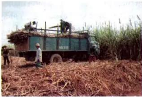
a) Thu hoạch mía