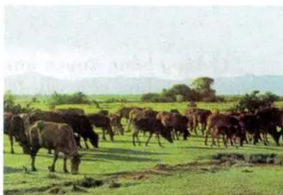
Hình 6. Chăn nuôi gia súc