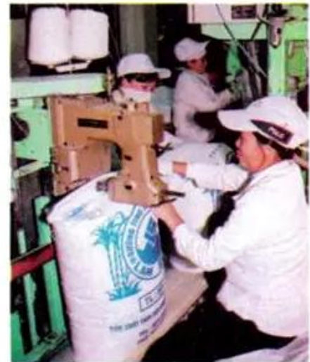
d) Đóng gói sản phẩm