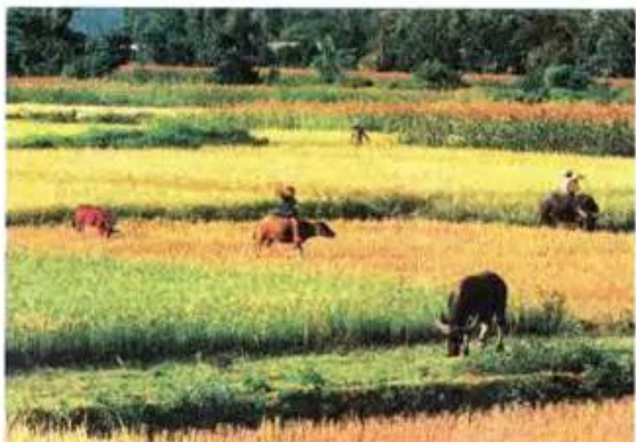
Hình 5. Cảnh đồng lúa