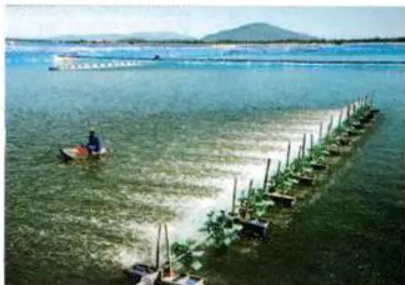
Hình 3. Đầm nuôi tôm công nghiệp

– Quan sát các hình sau, em hãy xếp các hình theo nhóm ngành sản xuất cho phù hợp : trồng trọt ; chăn nuôi ; nuôi trồng, đánh bắt thủy sản ; các ngành khác.