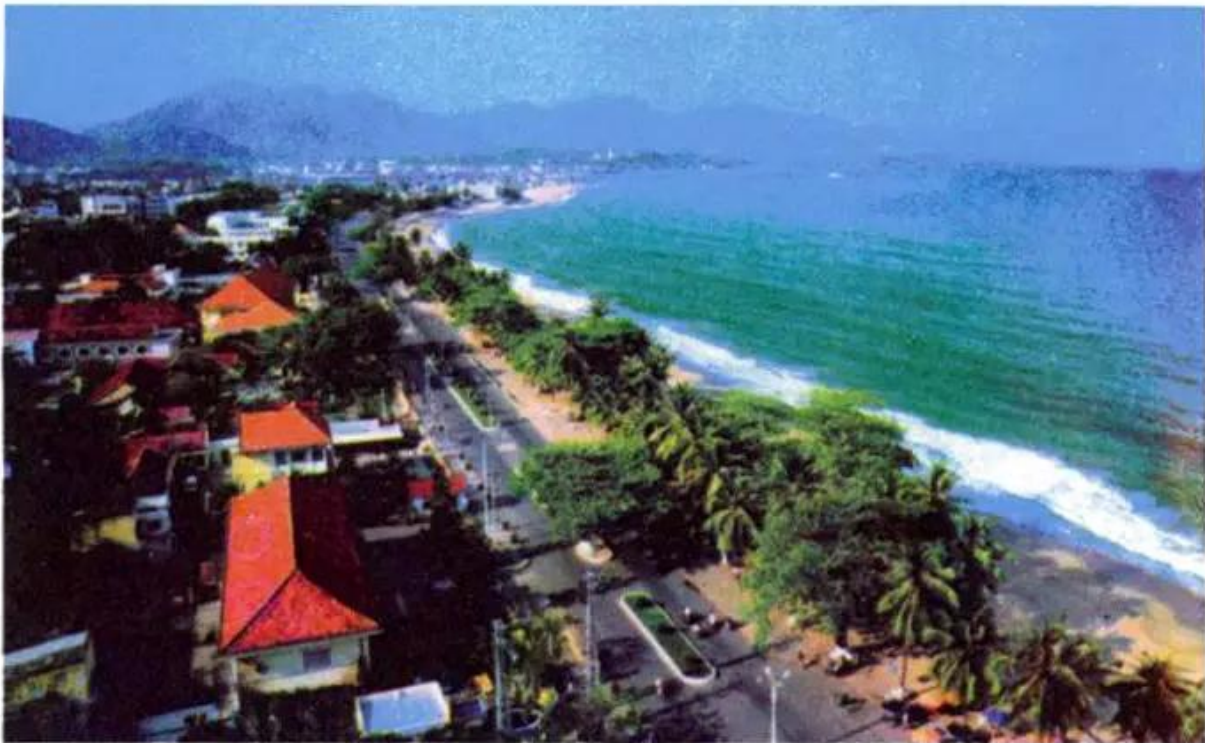
Hình 9. Bãi biển Nha Trang

Duyên hải miền Trung có nhiều bãi biển đẹp, bằng phẳng, phủ cát trắng rợp bóng dừa và phi lao, nước biển trong xanh. Đó là những địa điểm thuận lợi cho khách du lịch đến tham quan, tắm biển, nghỉ dưỡng như : Sầm Sơn (Thanh Hoá), Lăng Cô (Thừa Thiên - Huế), Mỹ Khê, Non Nước (Đà Nẵng), Nha Trang (Khánh Hoà), Mũi Né (Bình Thuận),... Ngoài ra còn có nhiều di sản văn hoá như cố đô Huế (Thừa Thiên - Huế), phố cổ Hội An, khu di tích Mỹ Sơn (Quảng Nam).