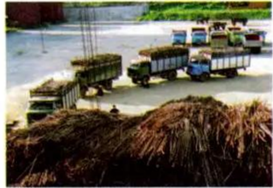
b) Vận chuyển mía