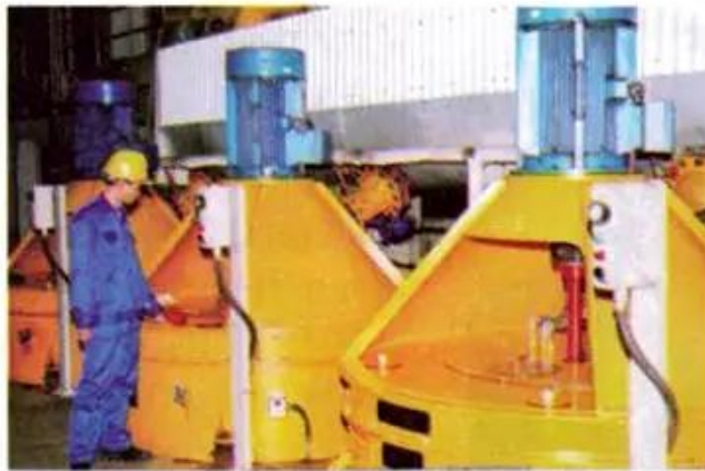
c) Sản xuất đường thô