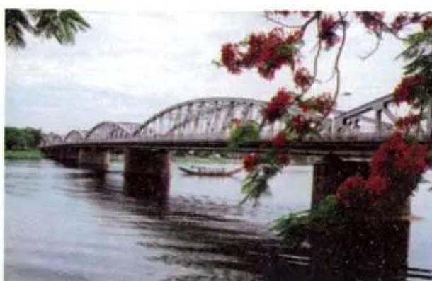
Hình 4. Cầu Trường Tiền

Thành phố Huế được xây dựng cách đây trên 400 năm và đã từng là kinh đô của nước ta thời nhà Nguyễn. Huế có nhiều cảnh thiên nhiên đẹp, nhiều công trình kiến trúc cổ có giá trị nghệ thuật cao nên thu hút rất nhiều khách du lịch.