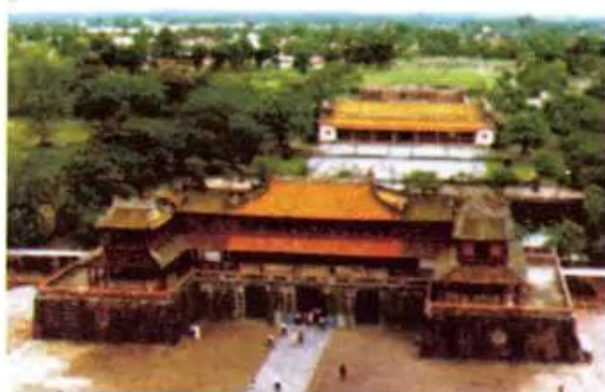
Hình 2. Kinh thành Huế

Tới Huế, khách du lịch còn được đi thăm các nhà vườn, thưởng thức những món ăn đặc sản của địa phương. Du khách còn được đi thuyền trên sông Hương và thưởng thức các bài dân ca Huế.