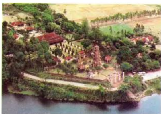
Hình 3. Toàn cảnh chùa Thiên Mụ