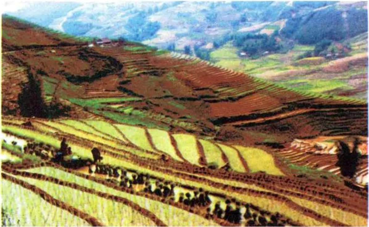
Hình 1. Ruộng bậc thang ở Hoàng Liên Sơn