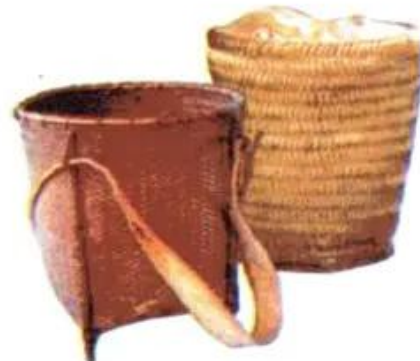
Hình 2. Một số mặt hàng thủ công truyền thống ở Hoàng Liên Sơn