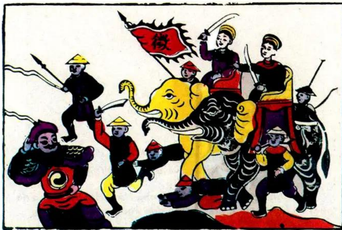
Hình 1. Hai Bà Trưng cưỡi voi ra trận (tranh dân gian Đông Hồ)

– Hai Bà Trưng kêu gọi nhân dân khởi nghĩa trong hoàn cảnh nào ?