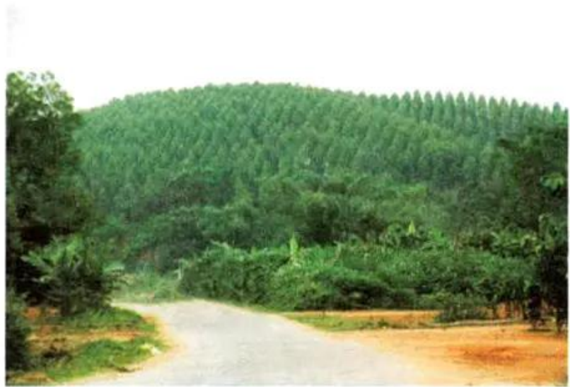
Hình 4. Trồng rừng phủ xanh đồi trọc

Để che phủ đồi, ngăn cản tình trạng đất đang bị xấu đi, người dân ở đây đã tích cực trồng rừng, cây công nghiệp lâu năm (keo, trấu, sớ,...) và cây ăn quả.