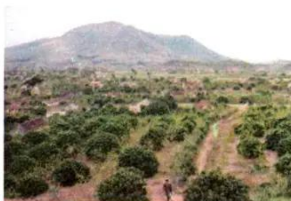
Hình 2. Trang trại trồng vải ở Bắc Giang

Chè và cây ăn quả là một trong những thế mạnh của vùng trung du. Chè được trồng để phục vụ nhu cầu trong nước và xuất khẩu. Thái Nguyên là nơi nổi tiếng có chè thơm ngon.