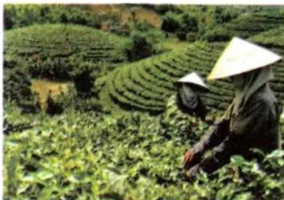
Hình 1. Đồi chè ở Thái Nguyên

– Hình 1 và hình 2 cho biết loại cây trồng nào có ở Thái Nguyên và Bắc Giang? Xác định vị trí của hai địa phương này trên bản đồ Địa lí tự nhiên Việt Nam.