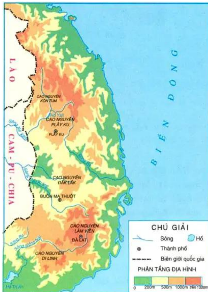
Hình 1. Lược đồ các cao nguyên ở Tây Nguyên

– Quan sát hình 1, em hãy đọc tên các cao nguyên (theo hướng từ Bắc xuống Nam) và chỉ vị trí của chúng trên lược đồ.