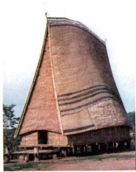
Hình 4. Nhà rông ở Tây Nguyên

– Quan sát hình 4, em hãy mô tả về nhà rông.