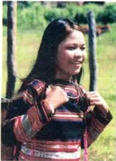
Hình 1. Người Gia-rai

Tây Nguyên có nhiều dân tộc cùng chung sống, nhưng lại là nơi thưa dân nhất nước ta. Những dân tộc sống lâu đời ở đây là Gia-rai, Ê-đê, Ba-na, Xơ-đăng,... Một số dân tộc từ nơi khác đến xây dựng kinh tế như Kinh, Mông, Tày, Nùng,... Tuy mỗi dân tộc có tiếng nói, tập quán sinh hoạt riêng, nhưng đều chung sức xây dựng Tây Nguyên trở nên ngày càng giàu đẹp.