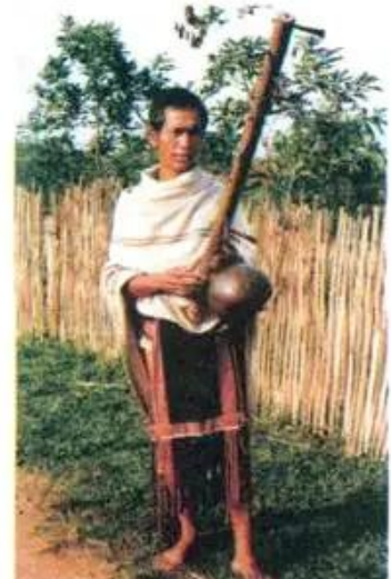
Hình 3. Người Xơ-đăng