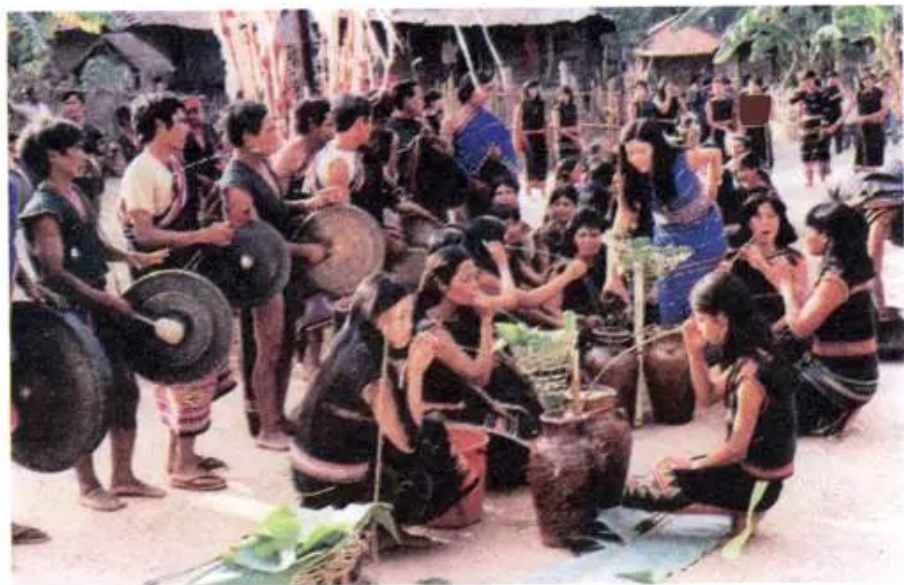
Hình 5. Lễ hội công chiêng