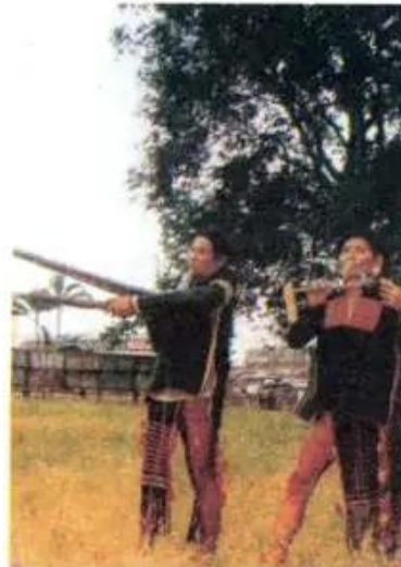
Hình 2. Người Ê-đê