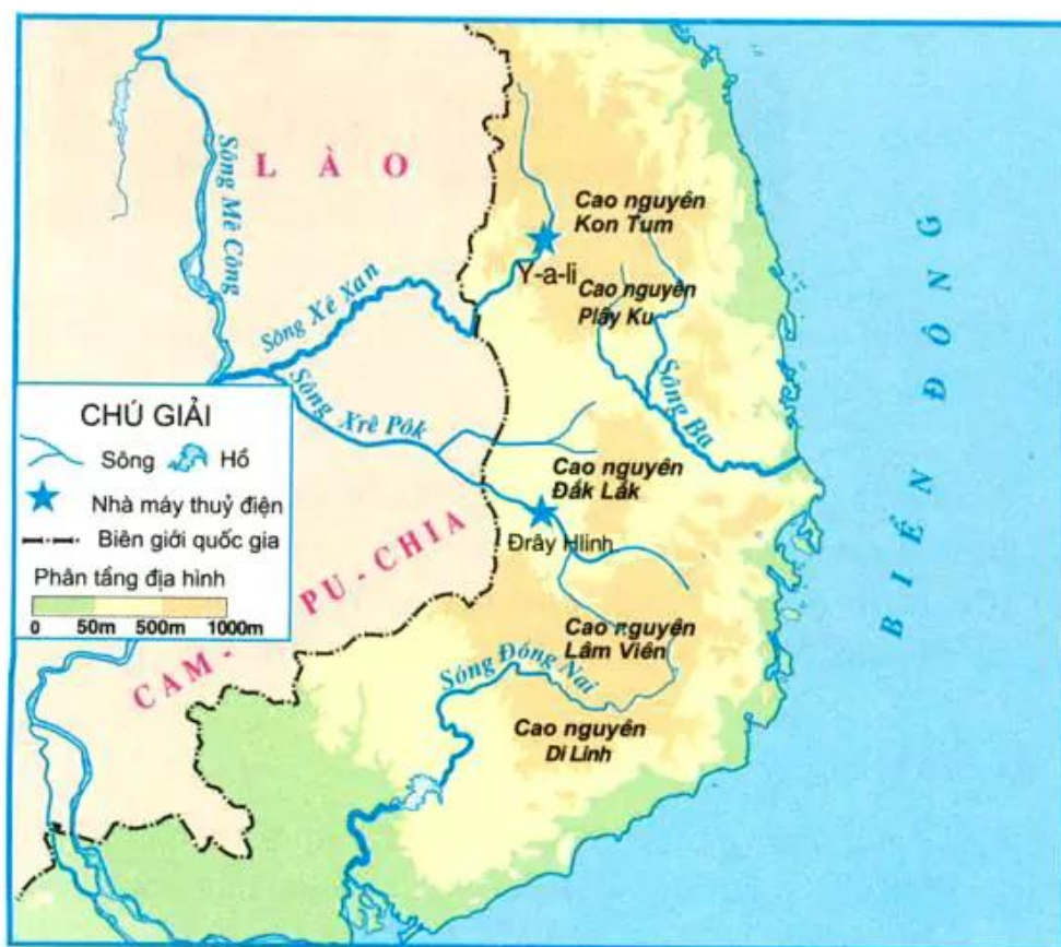
Hình 4. Lược đồ các sông chính ở Tây Nguyên

Tây Nguyên là nơi bắt nguồn của nhiều con sông. Các sông ở đây chảy qua nhiều vùng có độ cao khác nhau nên lòng sông lắm thác ghềnh. Người ta đã đắp đập, ngăn sông tạo thành hồ lớn và dùng sức nước chảy từ trên cao xuống để chạy tua-bin sản xuất ra điện. Các hồ chứa này còn có tác dụng giữ nước, hạn chế những cơn lũ bất thường.