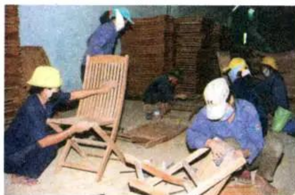
Hình 10. Xưởng mộc

– Quan sát các hình trên và mô tả quy trình làm ra các sản phẩm đồ gỗ như bàn, ghế.