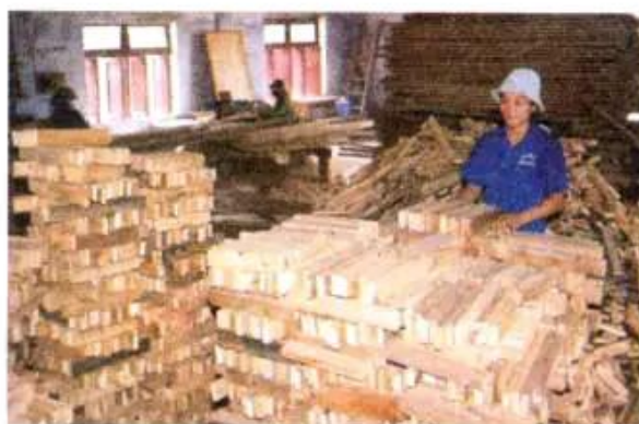
Hình 9. Xưởng cưa, xẻ gỗ