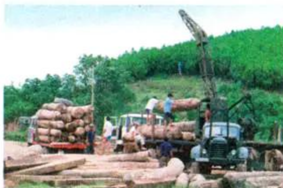
Hình 8. Vận chuyển gỗ

Rừng đem lại nhiều lợi ích, vì vậy cần phải bảo vệ và khai thác hợp lí.