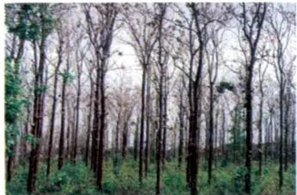
Hình 7. Rừng khộp

– Quan sát hình 6 và 7, em hãy mô tả rừng rậm nhiệt đới và rừng khộp.