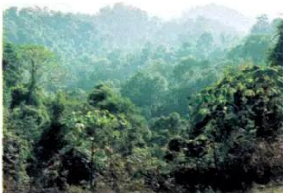
Hình 6. Rừng rậm nhiệt đới

Tây Nguyên có nhiều loại rừng. Nơi có lượng mưa nhiều thì rừng rậm nhiệt đới phát triển. Nơi mùa khô kéo dài thì xuất hiện loại rừng rụng lá mùa khô với cái tên khá đặc biệt là rừng khộp (hay khộc). Cảnh rừng khộp vào mùa khô trông xơ xác vì lá rụng gần hết.