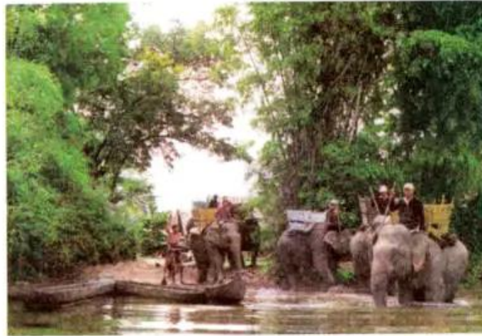
Hình 3. Đàn voi ở Buôn Đôn, tỉnh Đắk Lắk

– Ở Tây Nguyên, voi được nuôi để làm gì ?