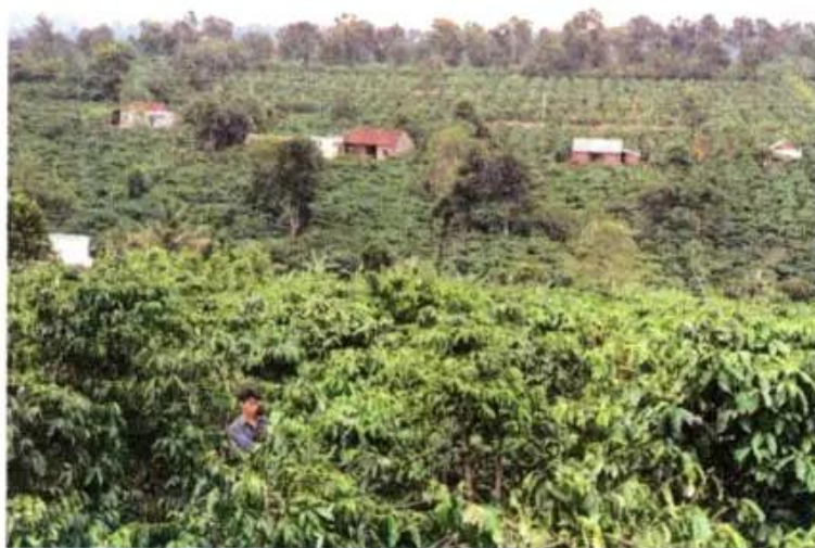
Hình 2. Cà phê ở Buon Ma Thuot

Hiện nay, Tây Nguyên có những vùng chuyên trồng cây công nghiệp lâu năm như : cà phê, cao su, chè, hồ tiêu,... Đó là những cây trồng có giá trị xuất khẩu cao.