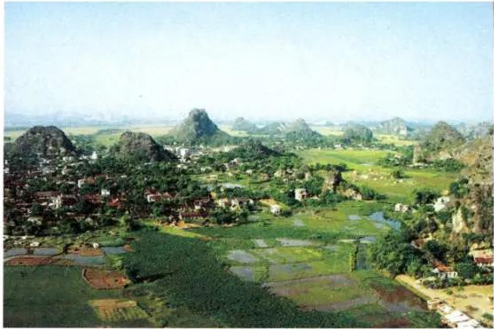
Hình 2. Cảnh Hoa Lư ngày nay

Chuyện xưa kể lại rằng, khi còn nhỏ, Đinh Bộ Lĩnh thường chơi với trẻ chăn trâu. Ông hay bắt bọn trẻ khoanh tay làm kiệu để ngồi cho chúng rước và lấy bông lau làm cờ bầy trận đánh nhau. Trẻ con xứ ấy đều nể sợ, tôn làm anh.