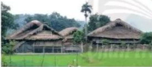
Nhà dân tộc Tây – Hà Giang