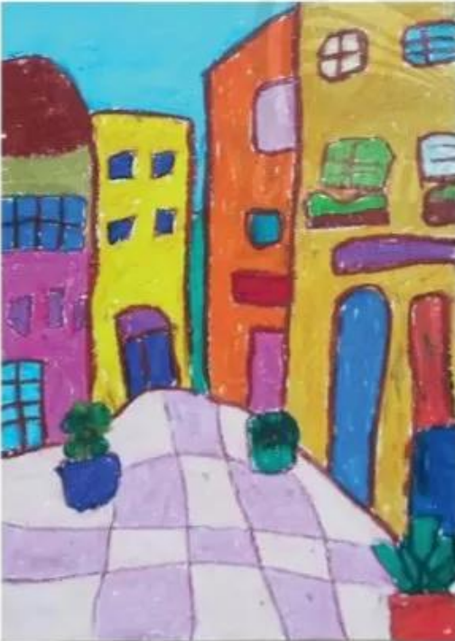
Khu phố, sếp màu. Song Như