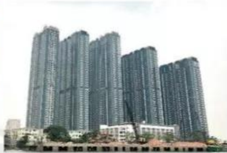
Chung cư ở Thành phố Hồ Chí Minh