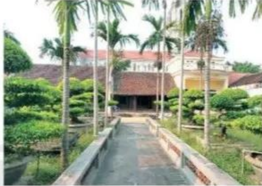
Nhà ở làng Tiêu Thượng – Hà Nam