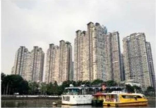
Nhà chung cư ở Thành phố Hồ Chí Minh, ảnh của Hạnh Trỗi