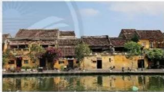
Nhà ở Hội An