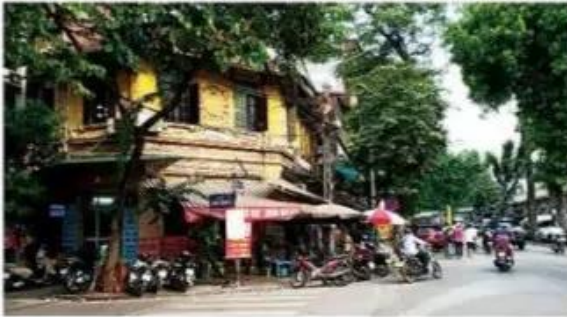
Phố cổ Hà Nội