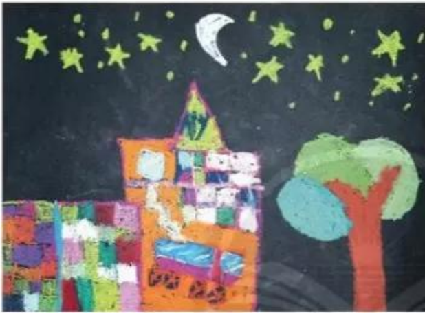
Đếm đầy sao, sếp màu. Song Như