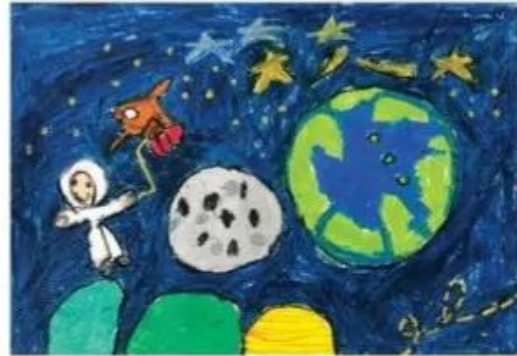
Bay lên, sếp màu, Đào Tiến Minh