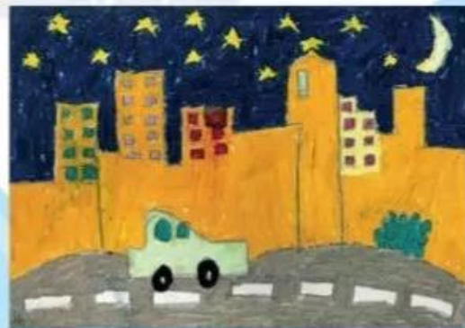
Thành phố em, sếp màu, Hồ Động Phương Vy