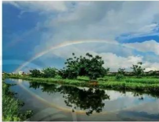
Cầu vồng