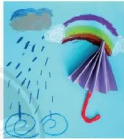
Cầu vồng, cốt dãn, sếp màu. Song An