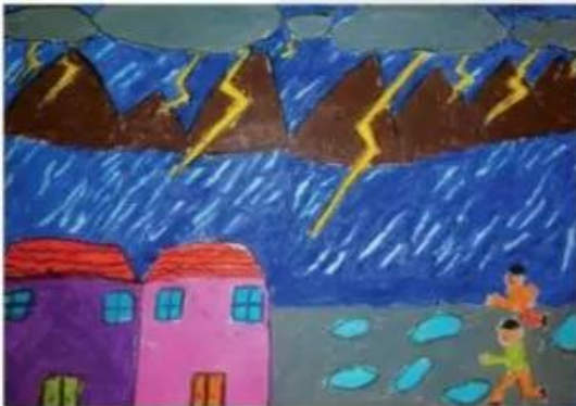
Sấm chớp, sáp màu, Võ Nhật