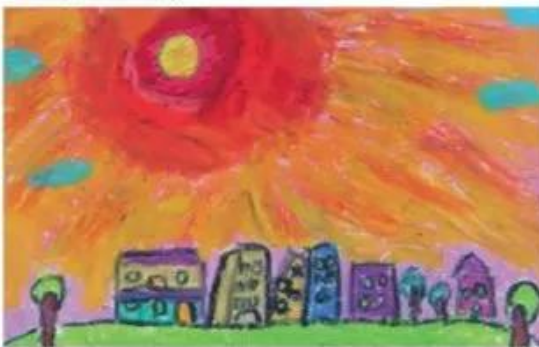
Trời nắng, sắp màu.