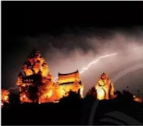
Sấm chớp