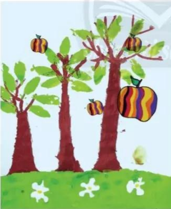
Vườn cây: màu bột. Đào Minh Ánh