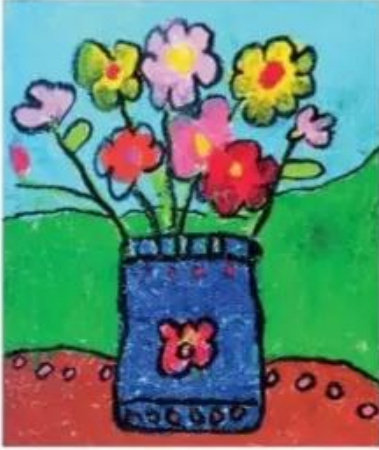
Bình hoa: sếp màu, Trần Bảo Châu