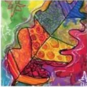
Chiếc lá màu bột, Song An