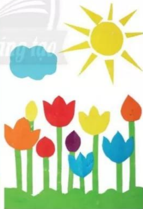
Vườn hoa nhà em, cắt dán. Sông Như