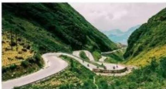
Đường đèo Hà Giang