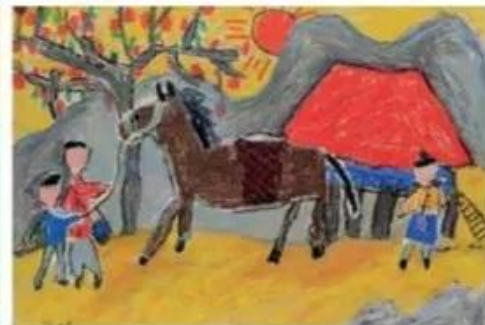
Người dân tộc, sếp màu, Gia Thiên

- Em hãy kể tên một số phong cảnh mà em biết.