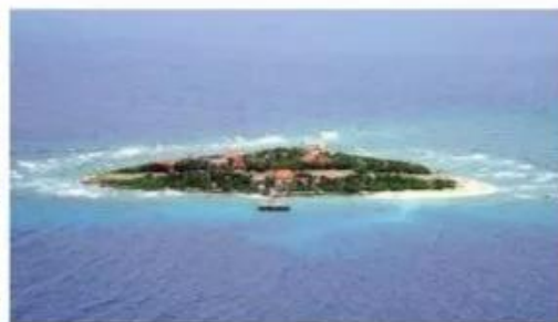
Thị trấn Trường Sa - Khánh Hoà, ảnh của Xuân Cường