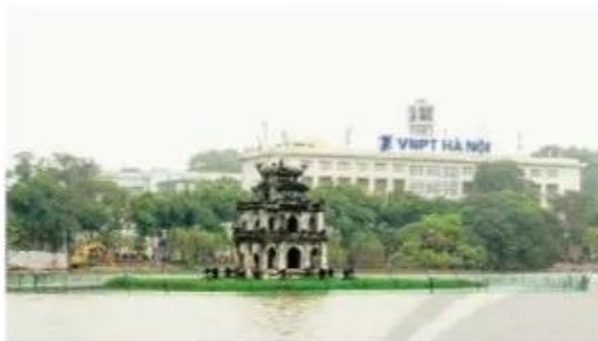
Tháp Rùa - Hà Nội