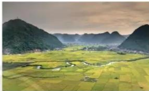
Cánh đồng Bắc Sơn