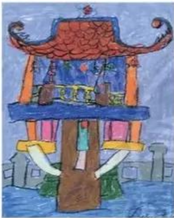
Chùa Một Cột sếp màu, Trần Diệu Linh