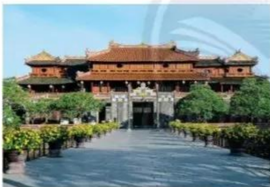
Ngọ Môn - Huế