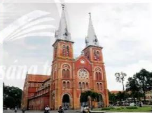
Nhà thờ Đức Bà - Thành phố Hồ Chí Minh