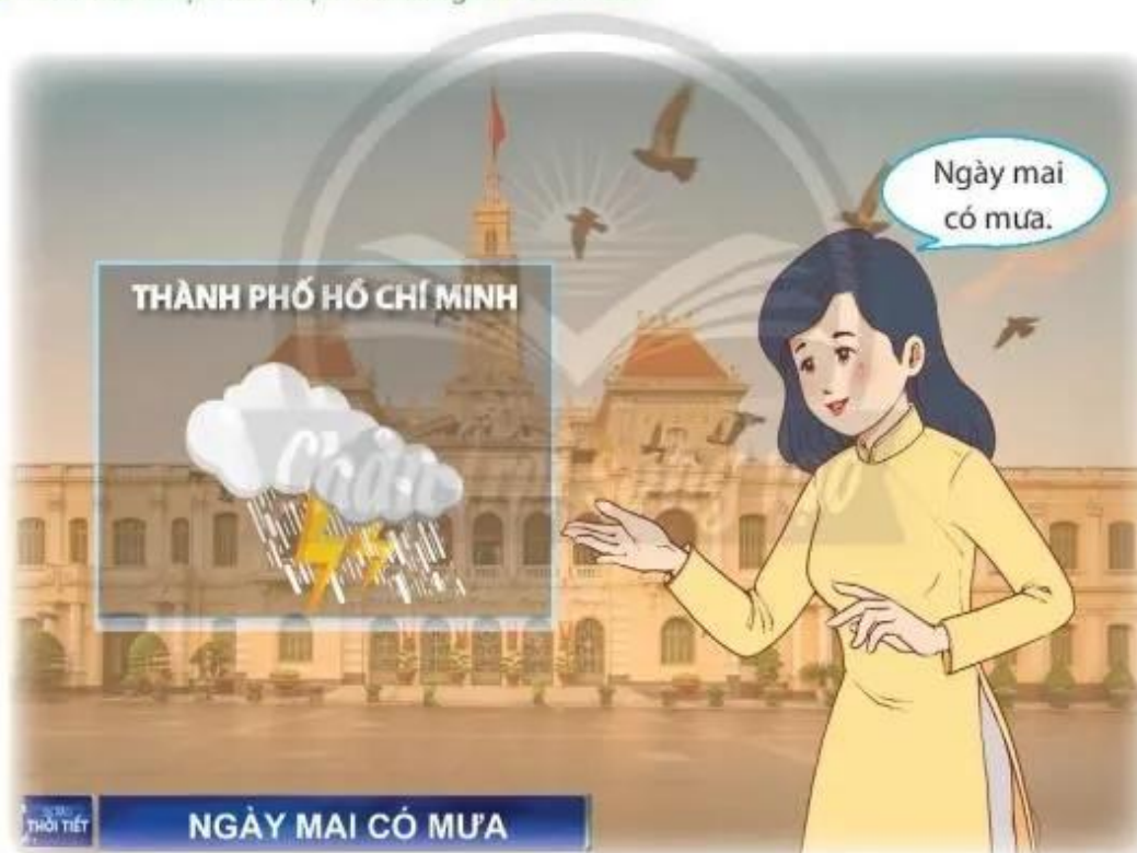
Hình 1. Bản tin dự báo thời tiết

Quan sát Hình 1 và cho biết thông tin thời tiết mà em thu nhận được. Thông tin có mưa được thể hiện ở những chi tiết nào?