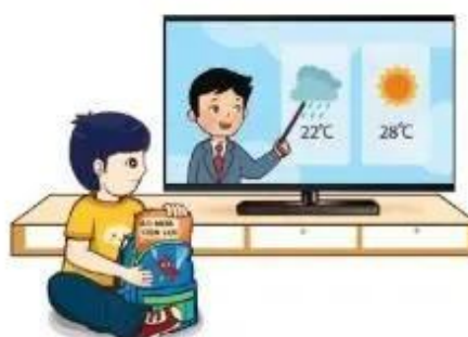
Hình 2. Xem thông tin thời tiết để quyết định mang hoặc không mang áo mưa

Như vậy, thông tin đóng vai trò quan trọng trong việc ra quyết định của con người.