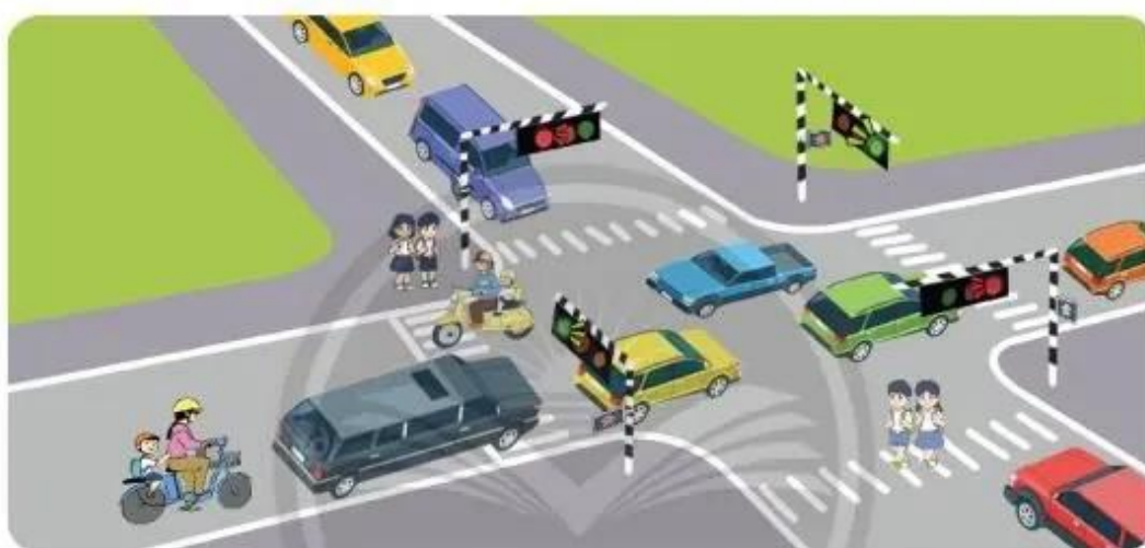
Hình 1. Người và phương tiện tham gia giao thông dừng lại khi thấy tín hiệu đèn đỏ

Quan sát Hình 1 và cho biết có những người và phương tiện tham gia giao thông nào đang dừng lại. Tại sao?