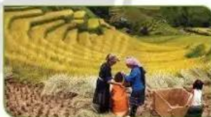
Hình 7b. Cho thóc vào bao