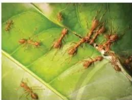
Hình 1a. Đàn kiến tìm cách tha lá to về tổ

Em hãy cho biết đàn kiến ở Hình 1a và Hình 1b đã làm thế nào để đưa được chiếc lá to về tổ?