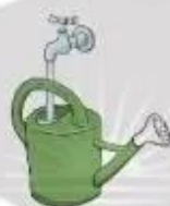
Hình 1b. Lấy nước