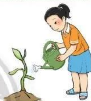
Hình 1c. Tưới nước cho cây