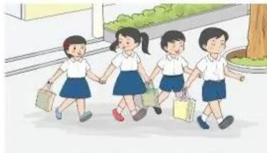
Hình 2b. Các bạn chia sách vào các túi nhỏ để vận chuyển