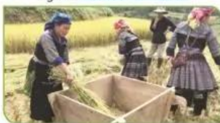
Hình 7d. Đập lúa