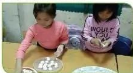
Hình 3a. Nặn bánh

Sắp xếp các Hình 3a, Hình 3b, Hình 3c, Hình 3d theo thứ tự cần thực hiện để mô tả việc làm bánh trôi.