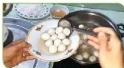
Hình 3b. Vớt bánh