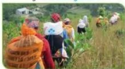
Hình 7c. Chuyển thóc về nhà