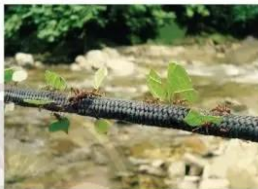
Hình 1b. Các chú kiến tha từng mảnh lá nhỏ về tổ