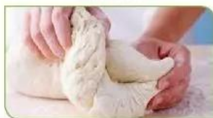
Hình 3d. Nhào bột