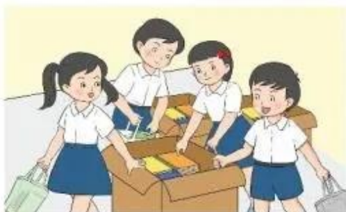
Hình 2a. Các bạn tìm cách chuyển thùng sách to và nặng

Ở Hình 2, các bạn nhỏ được giao nhiệm vụ chuyển một số thùng sách to và nặng vào thư viện trường. Em hãy cho biết các bạn làm thế nào để có thể dễ dàng thực hiện được công việc này.