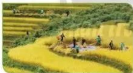
Hình 7a. Gặt lúa

2. Em hãy sắp xếp các hình dưới đây theo thứ tự các bước để thu hoạch lúa của đồng bào vùng cao Tây Bắc.