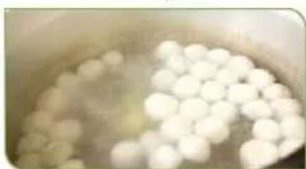
Hình 3c. Luộc bánh