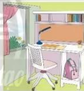
Hình 4. Góc học tập ở nhà của bạn Lan