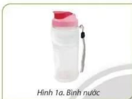
Hình 1a. Bình nước

Em hãy khuyên bạn Lan mang đồ dùng cá nhân đi học phù hợp với thời tiết.