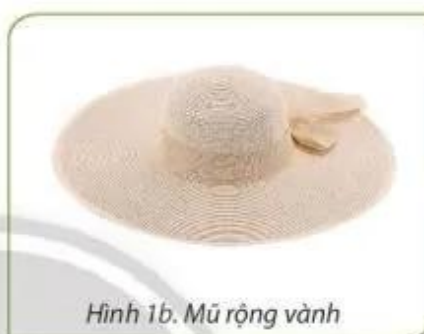
Hình 1b. Mũ rộng vành