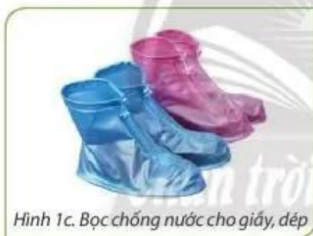
Hình 1c. Bọc chống nước cho giày, dép