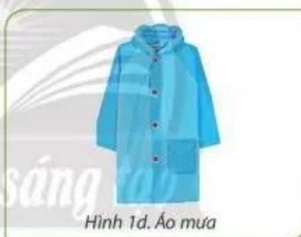
Hình 1d. Áo mưa

Hình 1. Một số đồ dùng mang hoặc không mang theo tùy thuộc vào thời tiết