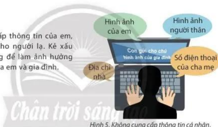
Hình 5. Không cung cấp thông tin cá nhân, gia đình cho người lạ

Không cung cấp thông tin của em, gia đình em cho người lạ. Kẻ xấu có thể sử dụng để làm ảnh hưởng đến an toàn của em và gia đình.