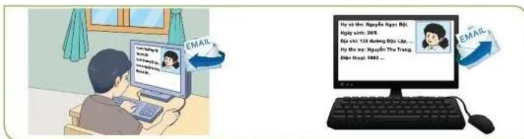
Hình 2a. Trao đổi thông tin qua thư điện tử

Quan sát Hình 2 và cho biết thông tin cá nhân, gia đình có thể được trao đổi nhờ máy tính bằng cách nào.