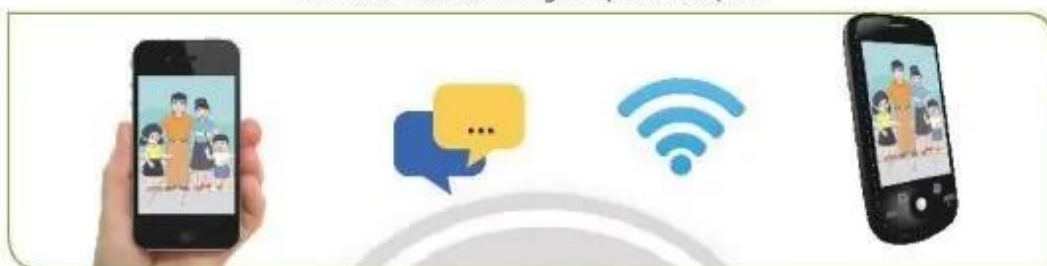
Hình 2b. Trao đổi thông tin qua tin nhắn