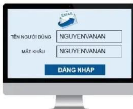
Hình 4. Không nên đặt mật khẩu dễ đoán

Một số người có thói quen lấy họ và tên, ngày sinh của bản thân, địa chỉ nhà để đặt mật khẩu cho hộp thư điện tử, tài khoản mạng xã hội, điện thoại, máy tính. Lợi dụng điều này, kẻ xấu có thể đoán được mật khẩu và truy cập, sử dụng tài khoản, thiết bị của nạn nhân để làm những việc xấu (lấy cắp thông tin, mạo danh để nói xấu, hăm dọa người khác, phát tán thư rác, ...).