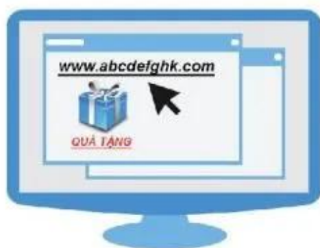
Hình 6. Không nhấp chuột vào liên kết web do người lạ gửi đến

Không nhấp chuột vào liên kết web (link) do người lạ gửi. Kẻ xấu có thể tạo những trang web giả mạo, khai thác thông tin cá nhân để lừa đảo, gây hại cho em và gia đình.