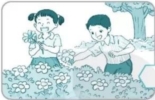
Hái hoa, bẻ cành cây ven đường