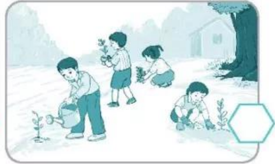
Trồng và chăm sóc cây