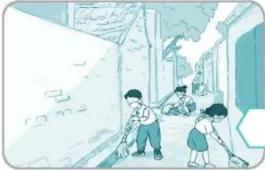
Quét dọn đường làng, ngõ xóm

Đánh dấu ✓ vào ở những việc em cần làm để thể hiện tình yêu quê hương.