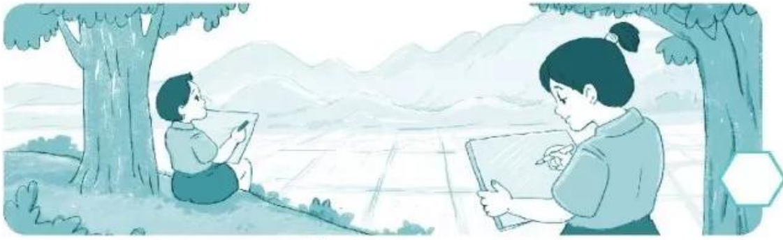
Vẽ tranh về cảnh đẹp quê hương