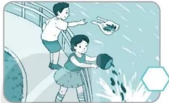
Vứt rác xuống hồ, ao, sông, suối