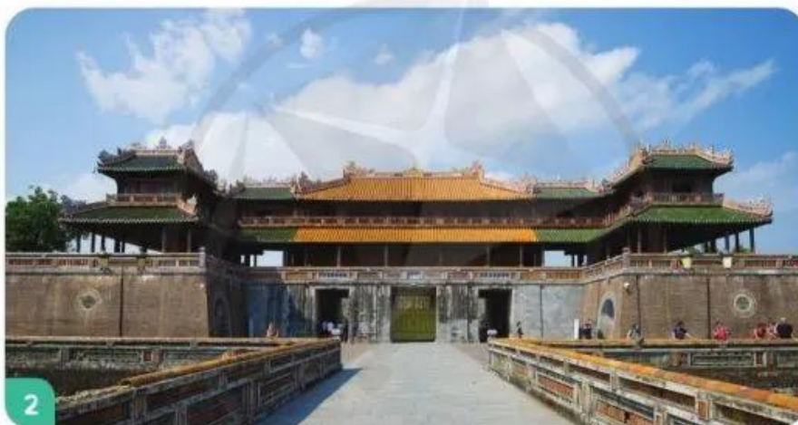
Đại nội Kinh thành Huế