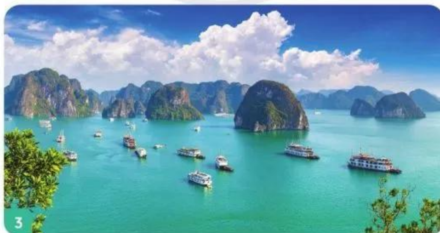
Vịnh Hạ Long