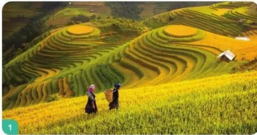
Ruộng bậc thang