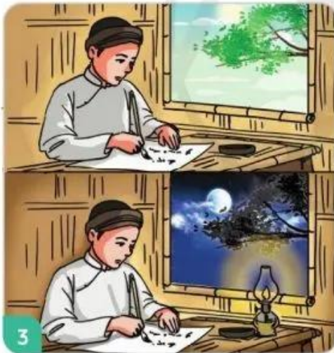
Cao Bá Quát quyết tâm luyện chữ.