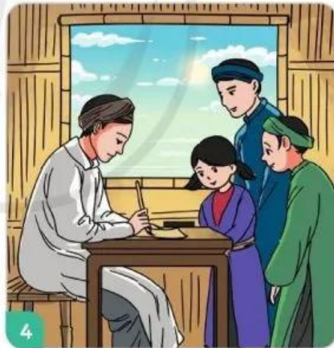
Mấy năm sau, mọi người đều kính trọng ông vì văn hay chữ tốt.

(Theo Bảo Linh, Chuyện kể về tám gương Đạo đức , NXB Hồng Đức, 2019)