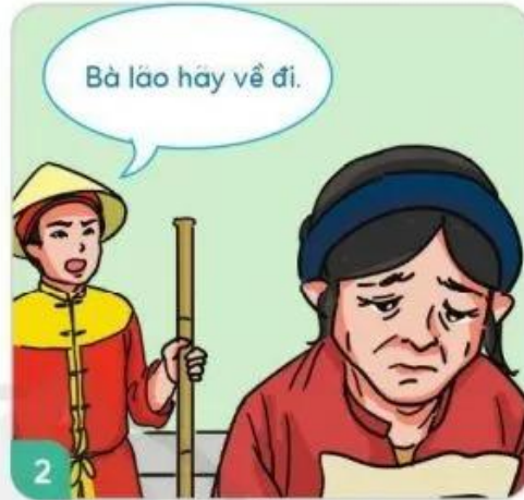
Lá đơn viết lí lẽ rõ ràng, nhưng quan không đọc được vì chữ quá xấu.