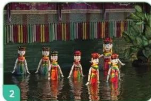
Múa rối nước