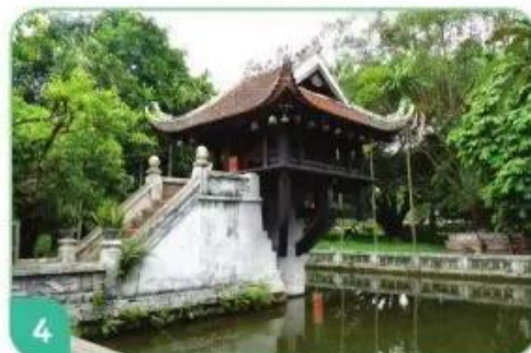
Chùa Một Cột