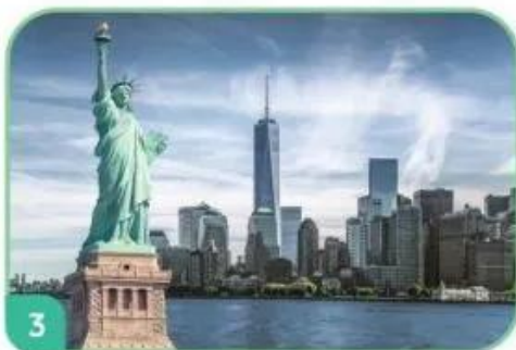
Tượng Nữ thần tự do