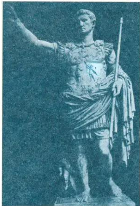
Hình 4. Tượng Ô-guyt

Phần dưới chân tượng Ô-guyt còn có tượng thần tình yêu A-mua cưỡi cá Đô-phin nhỏ nên có thể coi đây là một nhóm tượng hoàn hảo và tuyệt đẹp.