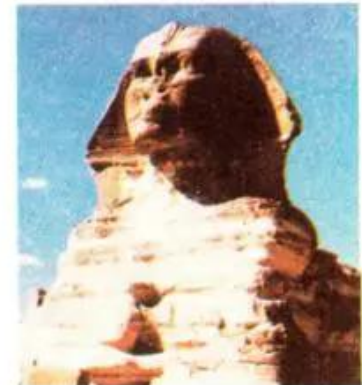
Hình 2. Đầu Tượng Nhân sư