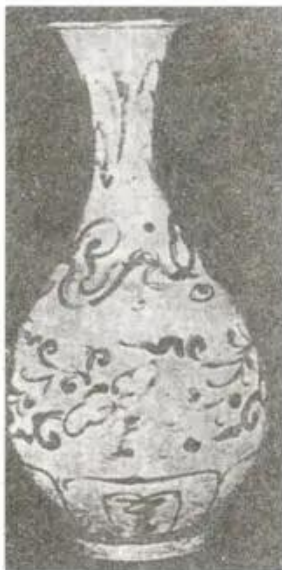
Hình 4. Bình gốm

Nghệ thuật gốm thời Lý rất tinh xảo thể hiện ở chất màu men khá phong phú ; xương gốm mỏng, nhẹ ; nét khắc chìm uyển chuyển ; hình dáng các đồ gốm nhẹ nhàng thanh thoát, trau chuốt mang vẻ đẹp trang trọng ; đề tài trang trí thường là chim muông, hình tượng bông sen, đài sen, lá sen cách điệu.