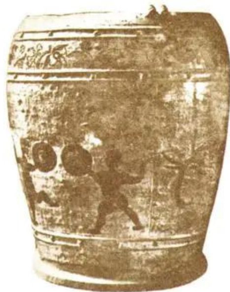
Hình 5. Thạp gốm (Thanh Hoá)