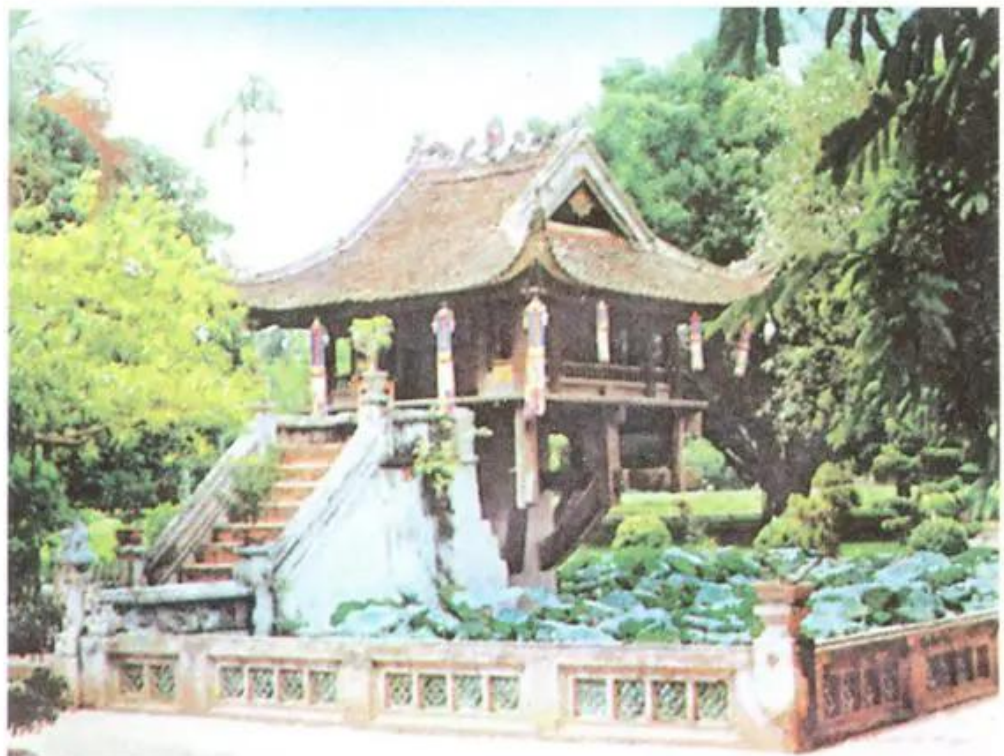
Hình 1. Chùa Một Cột

Ngôi chùa đã qua nhiều lần trùng tu (lần cuối cùng vào năm 1954) nhưng vẫn giữ nguyên cấu trúc như ban đầu. Những đường cong mềm mại của mái, nét khoẻ khoắn của cột và các chi tiết kiến trúc đã tạo nên sự hài hoà giữa những khoảng sáng, tối ẩn hiện lung linh trong không gian yên tĩnh.