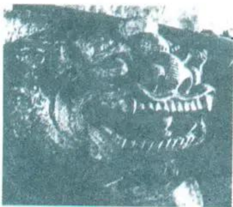
Hình 2. Sur tử thế kỷ XII (Chùa Bà Tấm, Gia Lâm, Hà Nội)

Đặc biệt, con rồng Việt Nam với đặc điểm riêng rất hiền lành, mềm mại được coi là hình tượng tiêu biểu cho nghệ thuật trang trí của dân tộc ta.