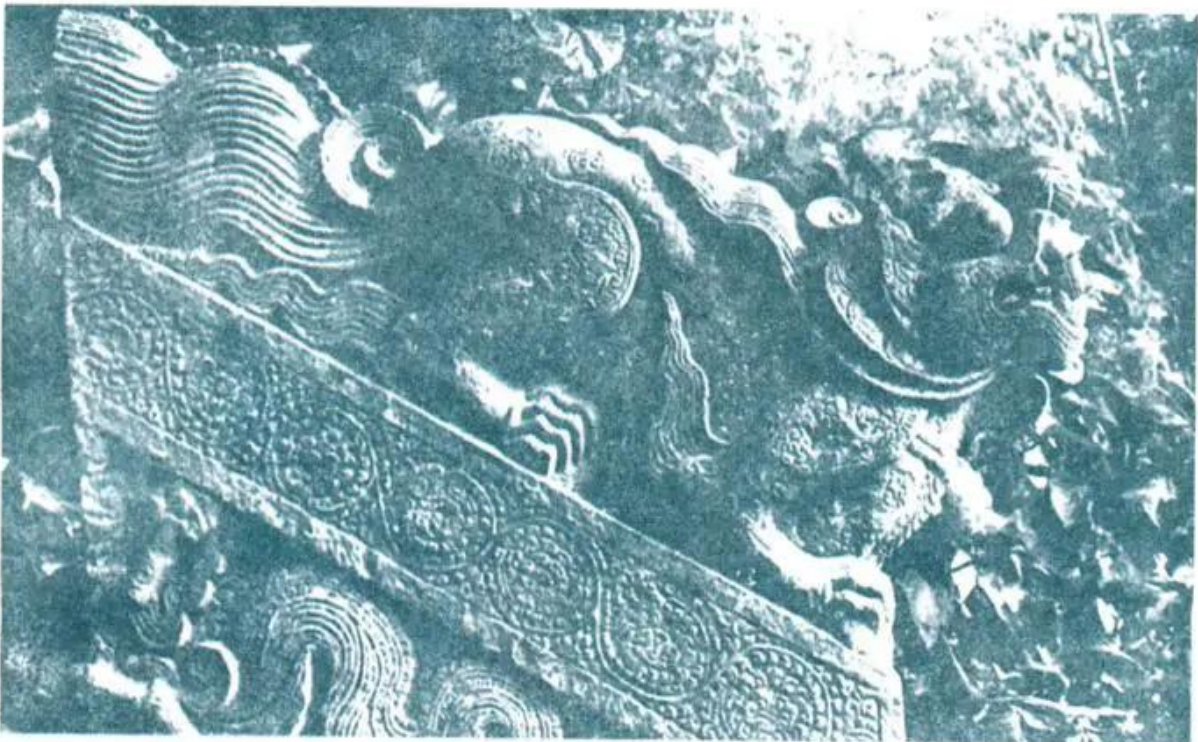
Hình 8. Tượng con sấu (Thành Thăng Long cổ)