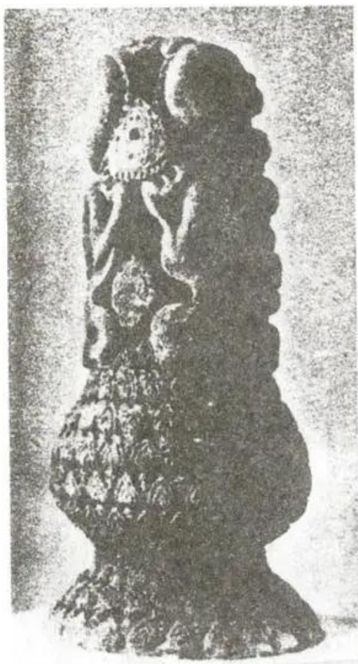
Hình 4. Trụ rồng cuốn thế kỉ XI (Bách Thảo, Ba Đình, Hà Nội)