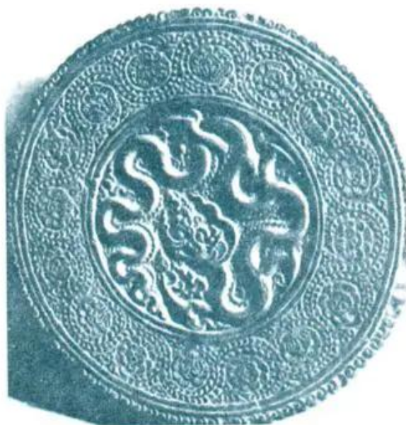
Hình 5. Hình con rồng và hoa dây (Chùa Phật Tích, Bắc Ninh)

Vào thời Lý, nước ta đã có những trung tâm sản xuất gốm nổi tiếng như Thăng Long, Bát Tràng, Thổ Hà, Thanh Hoá. Gốm men ngọc, men da lươn, men trắng ngà ... với nhiều hình dáng trang trí khác nhau và được trau chuốt bằng kĩ thuật chế tác cao. Đó là những di sản nghệ thuật đặc biệt quý giá.