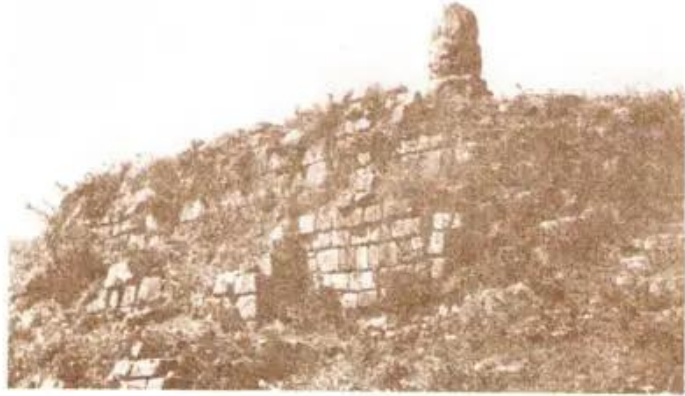
Hình 7. Dấu tích Chùa Dạm (Bắc Ninh)

Mĩ thuật thời Lý là thời kì phát triển rực rỡ của nền nghệ thuật Việt Nam.