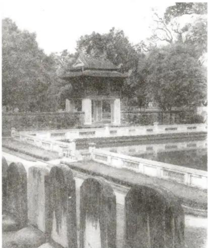
Hình 1. Văn Miếu - Quốc Tử Giám (Hà Nội)

Kinh thành Thăng Long là một quần thể kiến trúc gồm hai lớp bên trong và bên ngoài gọi là Hoàng thành và Kinh thành. Hoàng thành có nhiều cung điện tráng lệ là nơi ở, nơi làm việc của Vua và Hoàng tộc. Kinh thành là khu vực sinh sống của các tầng lớp dân cư trong xã hội với nhiều công trình kiến trúc nổi tiếng, trong đó có Quốc Tử Giám.