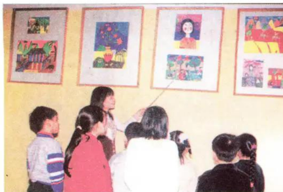
Hình 1. Cô giáo và học sinh trong phòng trưng bày kết quả học tập.