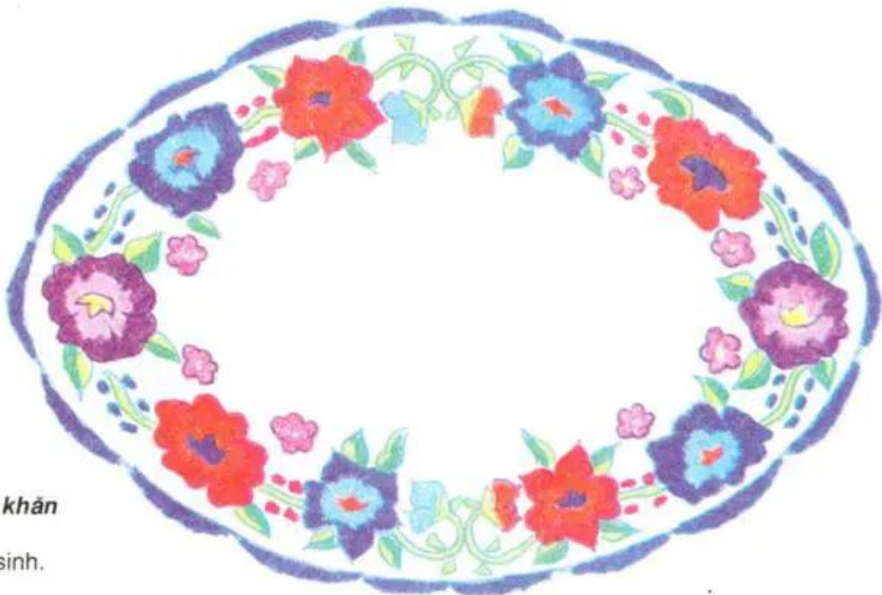
Hình 5 Trang trí chiếc khăn để đặt lọ hoa Bài vẽ của học sinh.