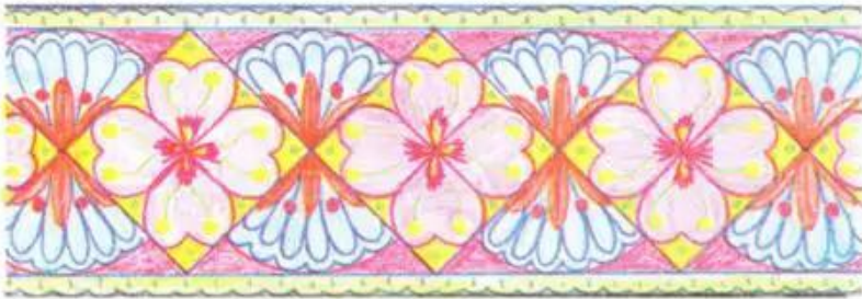
Hình 4 Trang trí đường diềm Bài vẽ của học sinh.