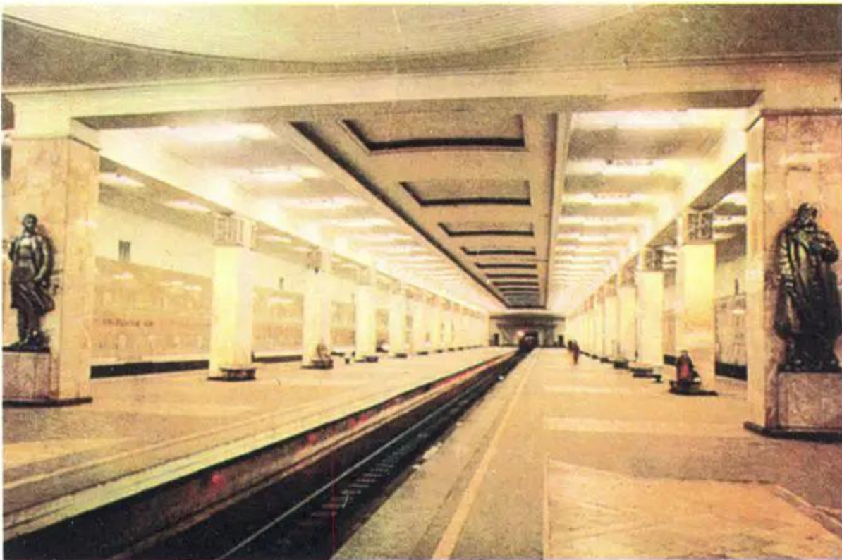
Hình 1. Cảnh vật nhìn theo phối cảnh