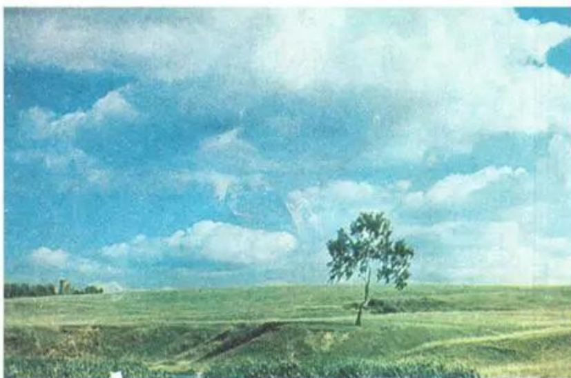
Hình 2. Đường tâm mắt ở thấp