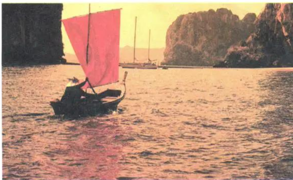
Hình 3. Đường tâm mắt ở cao