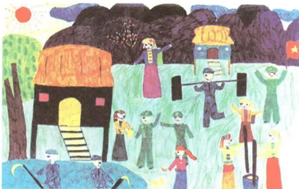
Hình 3. Tình quân dân. Tranh bút dạ của học sinh.