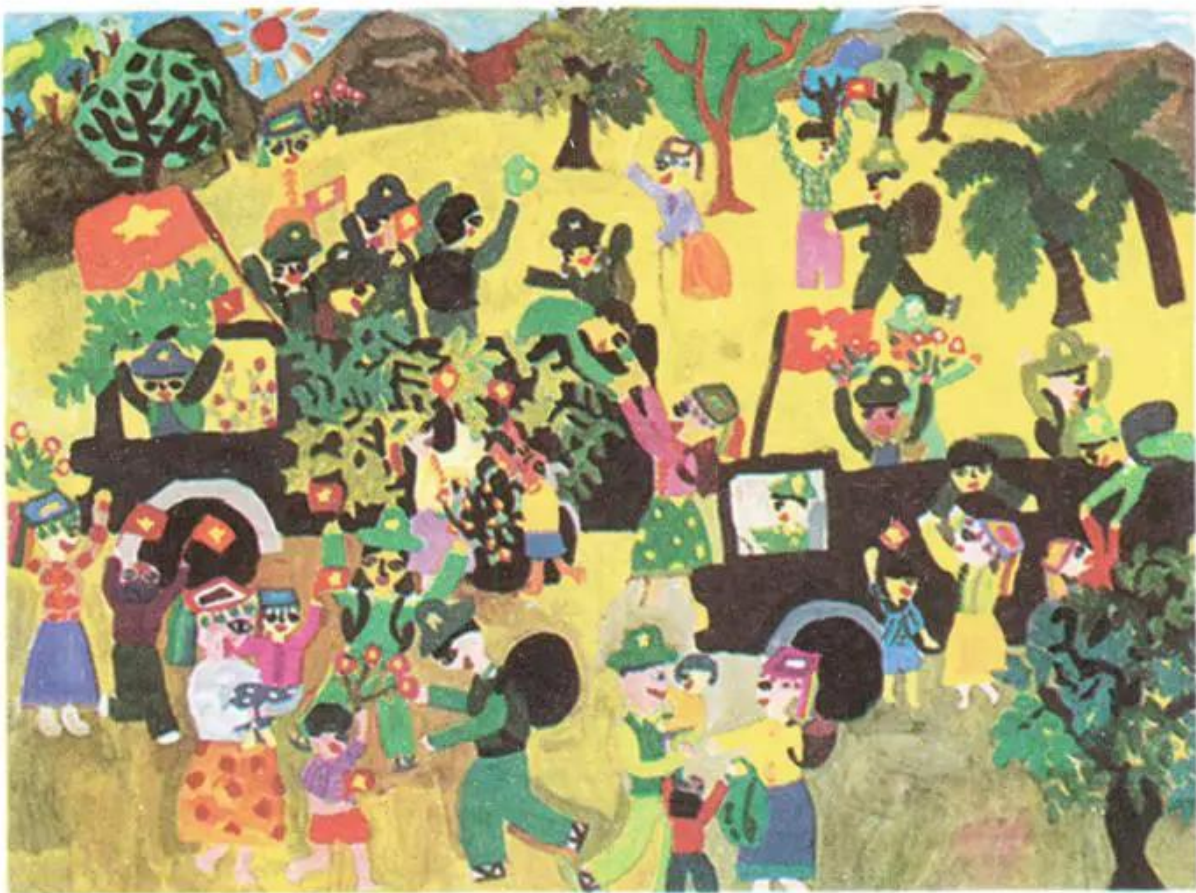
Hình 6. Mừng ngày chiến thắng. Tranh màu bột của học sinh.