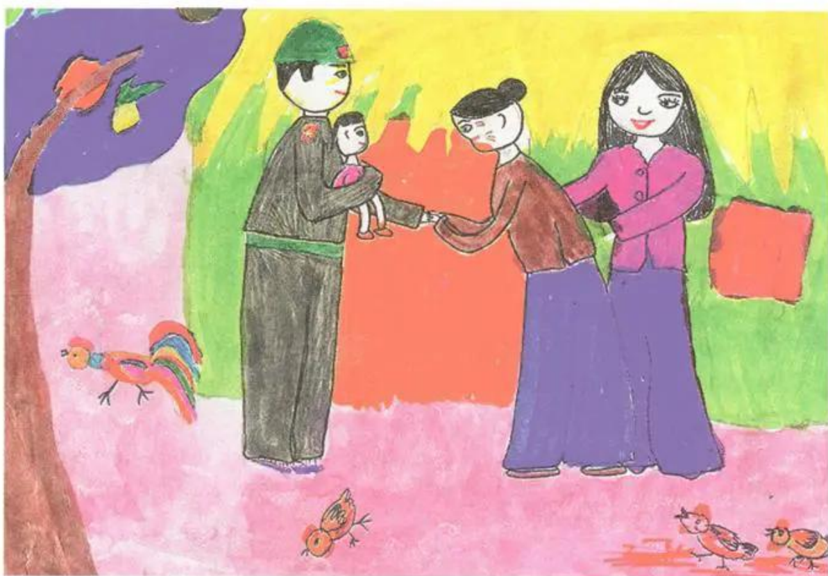
Hình 2. Thăm nhà. Tranh màu nước của học sinh.