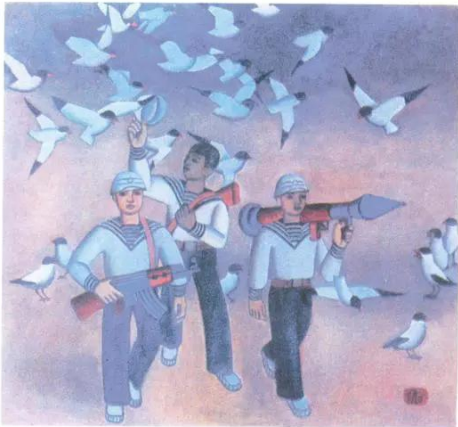
Hình 5. Hoa biển Tranh sơn dầu của hoạ sĩ Đỗ Sơn.