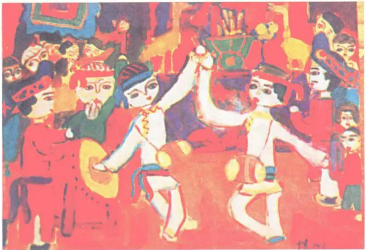
Hình 3. Hội làng . Tranh màu bột của học sinh.