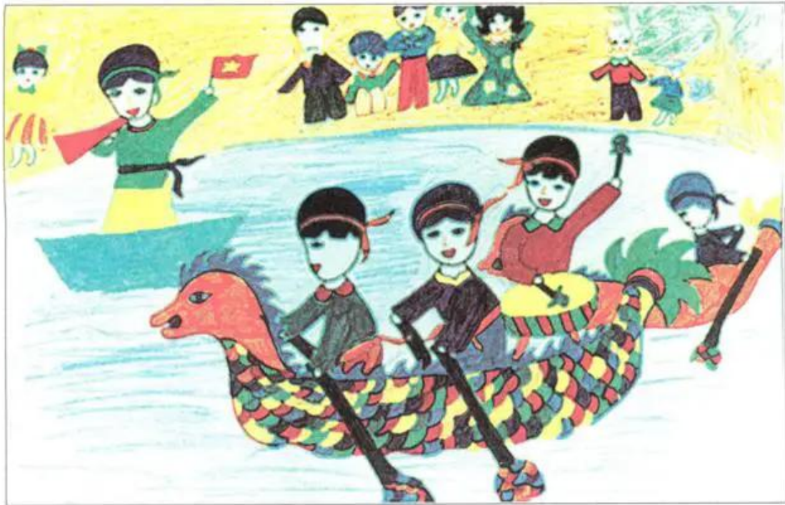
Hình 2. Bơi thuyền . Tranh sếp màu của học sinh.