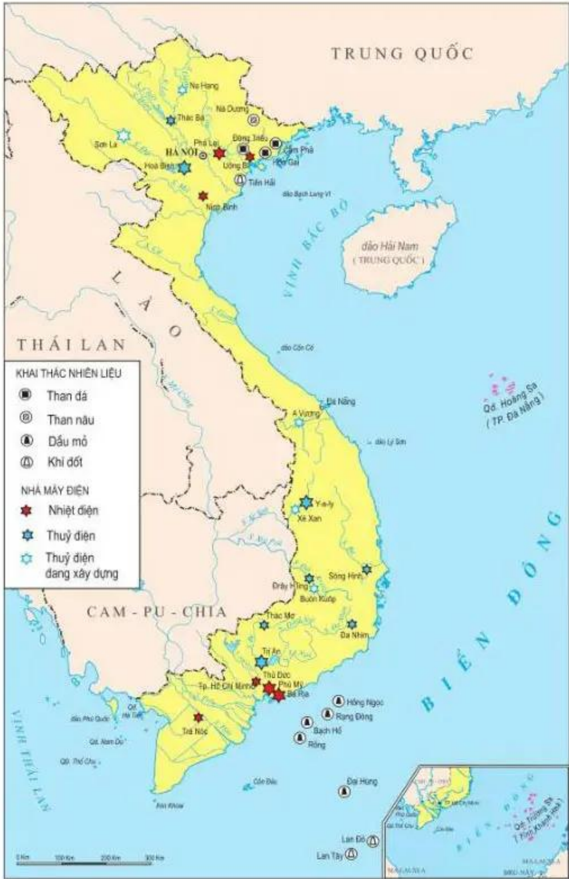
Hình 12.2. Lược đồ công nghiệp khai thác nhiên liệu và công nghiệp điện, năm 2002