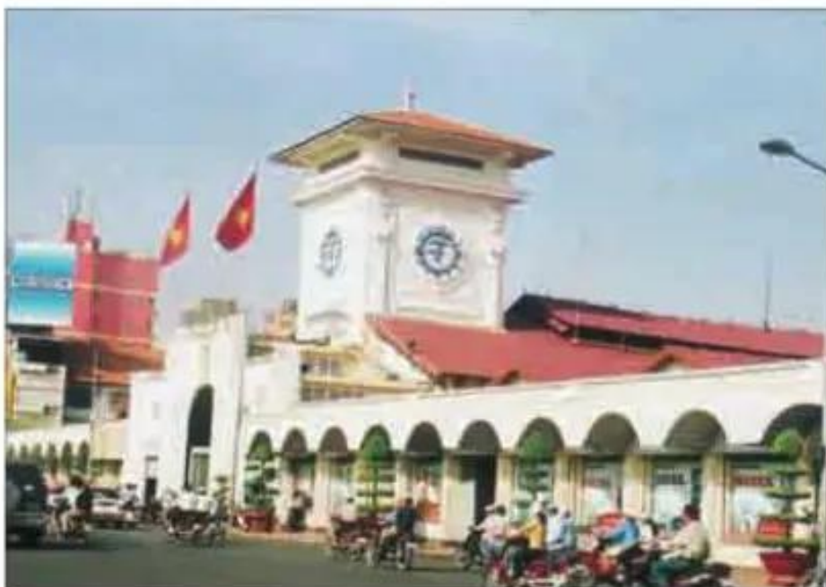
Hình 15.3. Chợ Bến Thành, TP. Hồ Chí Minh