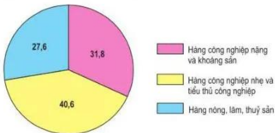
Hình 15.6. Biểu đồ cơ cấu giá trị xuất khẩu, năm 2002 (%)

Ngoại thương là hoạt động kinh tế đối ngoại quan trọng nhất ở nước ta. Nền kinh tế càng phát triển và mở cửa thì hoạt động ngoại thương càng quan trọng, có tác dụng trong việc giải quyết đầu ra cho các sản phẩm, đổi mới công nghệ, mở rộng sản xuất với chất lượng cao và cải thiện đời sống nhân dân.