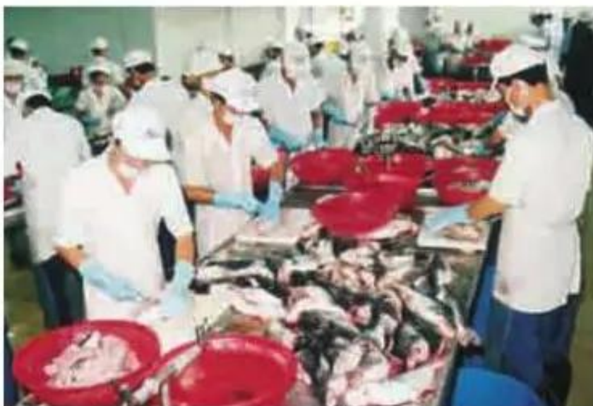
Hình 15.7. Chế biến cá tra xuất khẩu

Hiện nay, nước ta buôn bán nhiều nhất với thị trường khu vực châu Á – Thái Bình Dương như Nhật Bản, các nước ASEAN, Trung Quốc, Hàn Quốc, Ô-xtrây-li-a và vùng lãnh thổ như Đài Loan. Thị trường châu Âu và Bắc Mỹ ngày càng tiêu thụ nhiều hàng hoá của Việt Nam.