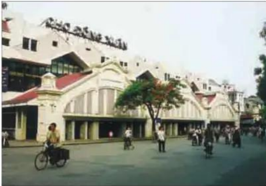
Hình 15.2. Chợ Đồng Xuân, Hà Nội

Hà Nội và Thành phố Hồ Chí Minh là hai trung tâm thương mại, dịch vụ lớn và đa dạng nhất nước ta. Ở đây có các chợ lớn, các trung tâm thương mại lớn, các siêu thị,... Đặc biệt, các dịch vụ tư vấn, tài chính, các dịch vụ sản xuất và đầu tư nói chung đã làm nổi bật hơn nữa vai trò và vị trí của hai trung tâm này.