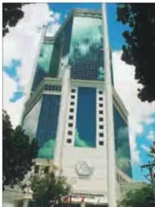
Hình 15.5. Trung tâm thương mại Sài Gòn