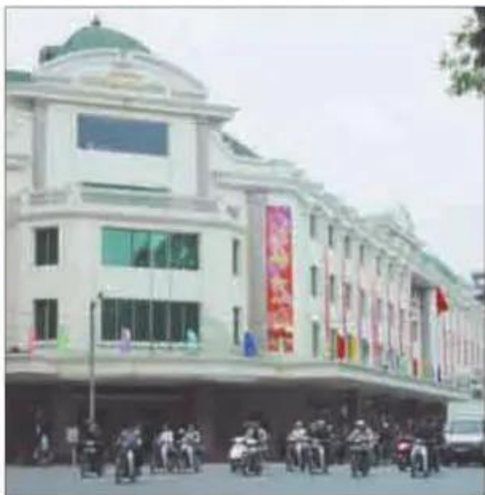
Hình 15.4. Trung tâm thương mại Tràng Tin, Hà Nội