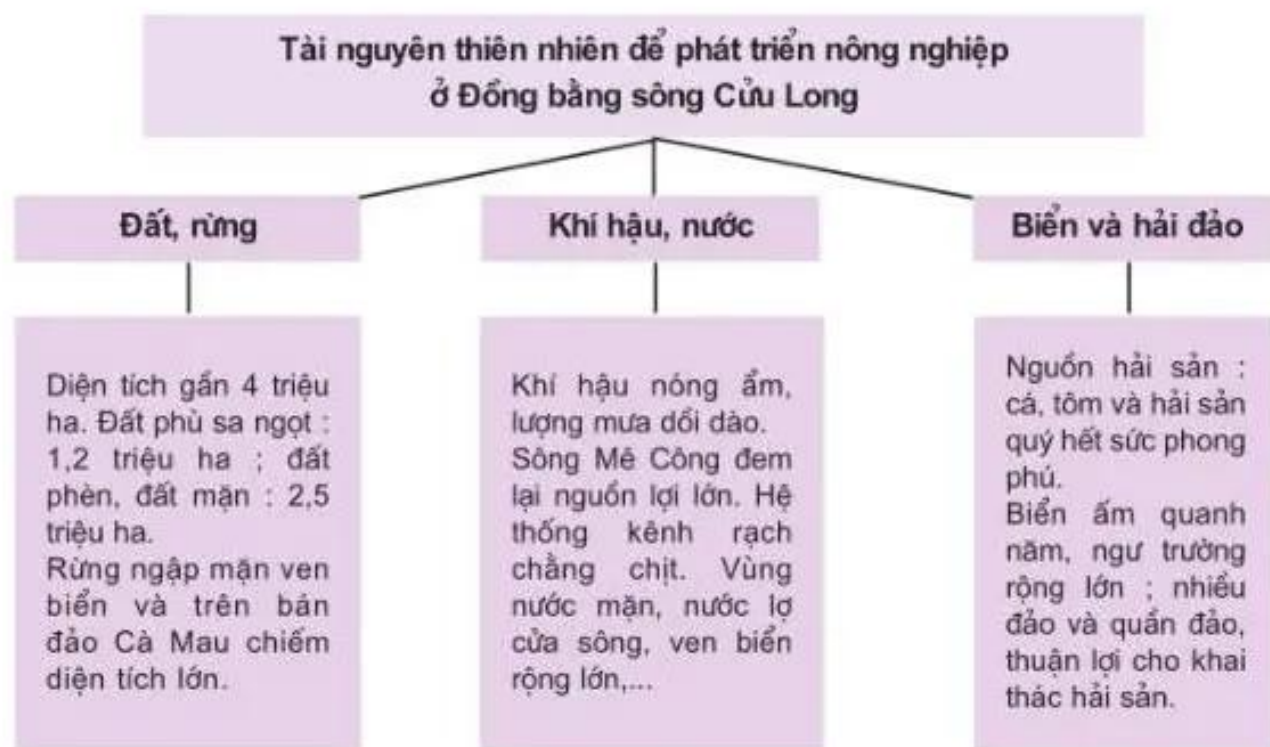
Hình 35.2. Sơ đồ tài nguyên thiên nhiên để phát triển nông nghiệp ở Đồng bằng sông Cửu Long