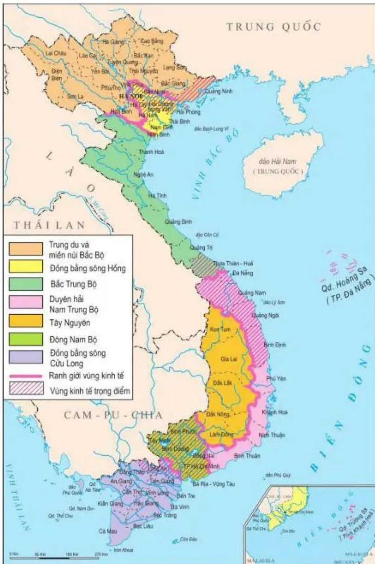
Hình 6.2. Lược đồ các vùng kinh tế và vùng kinh tế trọng điểm, năm 2002.

Từ ngày 1-8-2008, Hà Tây được sáp nhập vào thành phố Hà Nội.