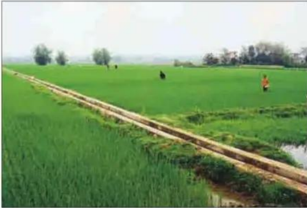
Hình 7.1. Kênh mương nội đồng đã được kiên cố hoá