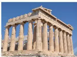
10.6 Đền Pác-tê-nông, kiệt tác kiến trúc của Hy Lạp cổ đại, được xây dựng dưới thời Pê-ri-clét.