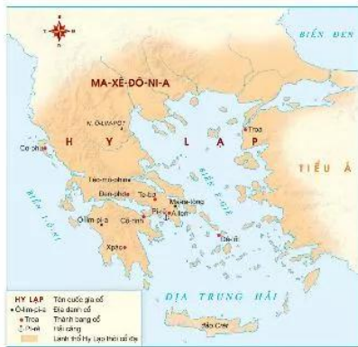
10.2 Lập đồ Hy Lạp cổ đại

GV nên mở rộng kiến thức: khái niệm “dân chủ” ngày nay có nguồn gốc từ tiếng Hy Lạp và mang ý nghĩa Quyền lực thuộc về nhân dân .