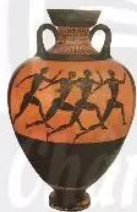
10.8 Thi chạy Ma-ra-tông (Marathon), hình vẽ trên bình gốm, 500 TCN

Hy Lạp còn nổi tiếng với những chiếc bình gốm. Đó thực sự là các kiệt tác nghệ thuật hoàn hảo, được coi là những "bộ sưu" phần ảnh lịch sử và muôn mặt của đời sống Hy Lạp cổ đại.