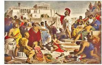
10.3 Một cuộc họp của "Đại hội nhân dân" dưới thời Pê-ríc-lét (Binh minh họa)

Quyền lực cao nhất thuộc về Đại hội nhân dân, gồm tất cả các nam công dân từ 18 tuổi trở lên, có quyền bầu cử, giám sát, bãi miễn các viên chức trong bộ máy nhà nước qua hình thức bỏ phiếu bằng vô số. Vào thời đại Pê-ríc-lét (Pericles), A-tên còn thực hiện chế độ bỏ nhiệm bằng bốc thăm, trả lương cho viên chức, nên những người nghèo cũng có thể tham gia chính quyền.