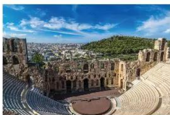
10.7 Nhà hát ngoài trời mang tên thần rượu nho Đê-ô-ni-xốt ở A-ten.