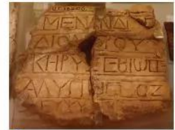
10.4 Chữ cổ Hy Lạp tìm thấy trên một bia mộ ở Ai Cập thế kỉ I

Nhờ sớm có chữ viết, nhiều tác phẩm văn học như hai bộ sử thi I-li-át (Iliad) và Ô-đi-xê (Odyssey) của Hô-me (Homer) được lưu lại cho đời sau, góp phần đặt nền móng cho văn học phương Tây. Nhiều vở kịch của các tác giả Ê-sin (Aeschylus), Xô-phốc (Sophocles), Ô-ri-pít (Euripides) đến nay vẫn được trình diễn, dựng thành phim.