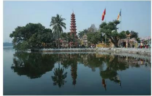
18.9 Chùa Trấn Quốc, nguyên là chùa Khai Quốc (chùa mở nước)

Mùa xuân năm 544, khởi nghĩa thắng lợi, Lý Bí lên ngôi vua, hiệu là Lý Nam Đế. Ông đặt tên nước là Vạn Xuân, đóng đô ở vùng cửa sông Tô Lịch (Hà Nội), cho xây điện Vạn Thọ và chùa Khai Quốc, cho đúc tiền riêng.