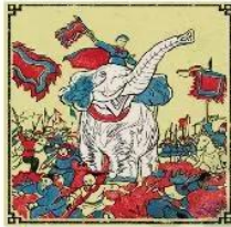
18.6 Bà Triệu cưỡi voi ra trận (Tranh minh họa)