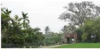
18.11 Làng cổ Đường Lâm, Hà Nội, nơi Phùng Hưng hợp quân khởi nghĩa.

Khoảng cuối thế kỉ VIII, ở làng Đường Lâm (Sơn Tây, Hà Nội), Phùng Hưng đã hợp quân khởi nghĩa và nhanh chóng làm chủ vùng Đường Lâm.