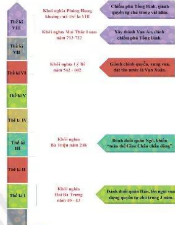
18.1 Sơ đồ các cuộc khởi nghĩa tiêu biểu chống Bắc thuộc

Chính sách thân tình, sáp nhập và đồng hoá của các triều đại phong kiến Trung Quốc nhằm xô đẩy lên đồi, lên làng, xuống núi và phong tục của người Việt góp phần khiến người Việt của nhân dân ta. Một ngàn năm không chịu cúi đầu, lớp lớp các thế hệ "con Rồng cháu Tiên" không ngừng vùng lên đấu tranh giành lại giang sơn gấm vóc và độc lập tự chủ cho dân tộc.