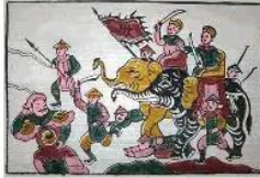
(Đại Việt sử ký toàn thư tập I, NXB Khoa học xã hội, Hà Nội, 1998, tr.156-157)

18.5 Đại Việt sử ký toàn thư chép rằng: “Trưng Trắc, Trưng Nhị là đàn bà, hồ một tiếng mà các quận Giao Chỉ, Cửu Chân, Nhật Nam, Hợp Phố cùng 65 thành trì ở Lĩnh ngoài đều hưởng ứng, việc dựng nước xưng vương dễ như trở bàn tay, có thể thấy hình thế đất Việt ta đủ dùng được nghiệp bá vương...”