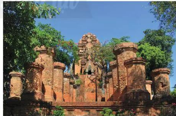
Cụm tháp Ponagar ở Nha Trang (Khánh Hoà), được xây dựng từ thế kỉ VIII và tiếp tục được xây mới sau thế kỉ X.