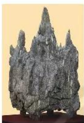
20.3 Trầm hương, sản vật có giá trị cao, dùng làm công phẩm và để buôn bán

Biển giữ một vai trò quan trọng trong hoạt động kinh tế của Chăm-pa. Một bộ phận lớn dân cư sống bằng nghề đánh cá và trao đổi sản vật với thuyền buôn đến từ nước ngoài.