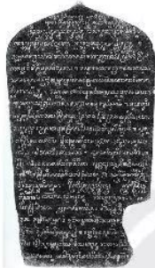
20.5 Một văn bia Chăm-pa, thế kỉ IV, di tích Mỹ Sơn (Quảng Nam)

Trên cơ sở tiếp thu chữ Phạn của Ấn Độ, Chăm-pa đã có chữ viết riêng vào thế kỉ IV.