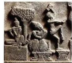
20.5 Nhạc công và vũ nữ, trang trí bề thế, thế kỉ VIII, di tích Mỹ Sơn (Quảng Nam)

Nhiều công trình kiến trúc, các tác phẩm điêu khắc vẫn được bảo tồn đến ngày nay.