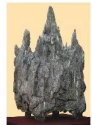
20.4 Trầm hương, sản vật có giá trị cao, dùng làm công phẩm và để buôn bán

Biên giới một vai trò quan trọng trong hoạt động kinh tế của Chăm-pa. Một bộ phận lớn dân cư sống bằng nghề đánh cá và trao đổi sản vật với thuyền buôn đến từ nước ngoài.