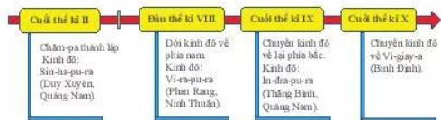
20.3 Sơ đồ quá trình phát triển của vương quốc Chăm-pa từ thế kỉ II đến thế kỉ X.

Từ thế kỉ II đến thế kỉ X, vương quốc Chăm-pa trải qua ba vương triều. Các trung tâm quan trọng của vương quốc gắn với những vùng địa lí khác nhau của miền Trung. Cuối thế kỉ IX, lãnh thổ Chăm-pa mở rộng nhất, bao gồm toàn bộ vùng ven biển, trải dài từ dãy Hoàng Sơn (Hà Tĩnh) ở phía bắc đến sông Dinh (Ninh Thuận) ở phía nam.