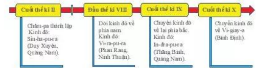
20.3 Sơ đồ quá trình phát triển của vương quốc Chăm-pa từ thế kỉ II đến thế kỉ X

Từ thế kỉ II đến thế kỉ X, vương quốc Chăm-pa trải qua ba vương triều. Các trung tâm quan trọng của vương quốc gắn với những vùng địa lí khác nhau của miền Trung. Cuối thế kỉ IX, lãnh thổ Chăm-pa mở rộng nhất, bao gồm toàn bộ vùng ven biển, trải dài từ dãy Hoàng Sơn (Hà Tĩnh) ở phía bắc đến sông Dinh (Ninh Thuận) ở phía nam.