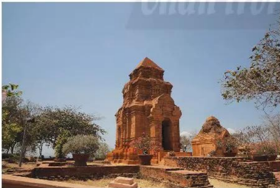
Cụm tháp Pô Shah Inur ở Phan Thiết (Bình Thuận) thế kỉ VII – VIII.