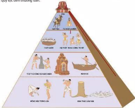
20.4 Sơ đồ tổ chức xã hội Chăm-pa

Sự đa dạng của nhiều ngành nghề đã tạo nên một xã hội với nhiều tầng lớp khác nhau từ quý tộc đến thường dân.