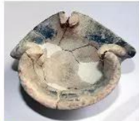
Hiện vật củ rơm trong văn hoá Óc Eo

Người Phù Nam đun nước trong những chiếc ấm vôi cổ ngỗng và nấu thức ăn bằng nồi gốm đất trên củ rơm. Củ rơm là loại củ đất có đáy giữ tro, có thể đun bằng củi hoặc than rất thuận tiện khi ở trên nhà sàn hay đi thuyền trên ghe, thuyền. Ngày nay, củ rơm vẫn được sử dụng khá phổ biến ở vùng nông thôn Tây Nam Bộ.