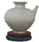
21.2 Bình gốm thế kỉ IV-VI (Bảo tàng Lịch sử Thành phố Hồ Chí Minh)

Nhiều sản phẩm thủ công nghiệp độc đáo thể hiện đặc trưng của vùng văn hoá sông nước vẫn còn tồn tại đến ngày nay.