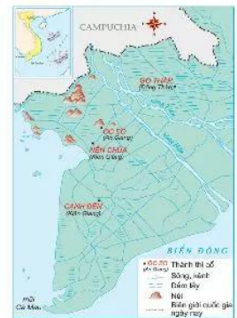
21.1 Lược đồ một số thành thị cổ của Phù Nam

Khảo cổ học đã phát hiện những dấu tích của một hệ thống các thành thị cổ Phù Nam ở vùng Đồng bằng sông Cửu Long. Nổi bật trong đó là Óc Eo ở An Giang; Nền Chùa và Canh Điền ở Kiên Giang; Gò Tháp ở Đồng Tháp. Các thành thị này được xây dựng trên bờ kênh, ngập nước 5 đến 6 tháng mỗi năm, chỉ cách biển từ 2 km đến 10 km và nối với nhau bằng những con kênh.