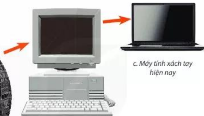
b. Máy tính thế hệ thứ 4 (1971 – 1980)