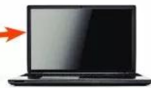
c. Máy tính xách tay hiện nay