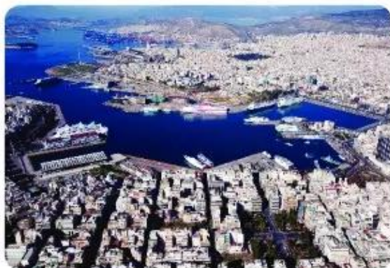
▲ Hình 3. Cảng Pi-rê ngày nay là cảng chính ở Hy Lạp, cách Thủ đô A-ten 11km. Đây cũng là cảng hành khách lớn nhất ở châu Âu và lớn thứ ba thế giới