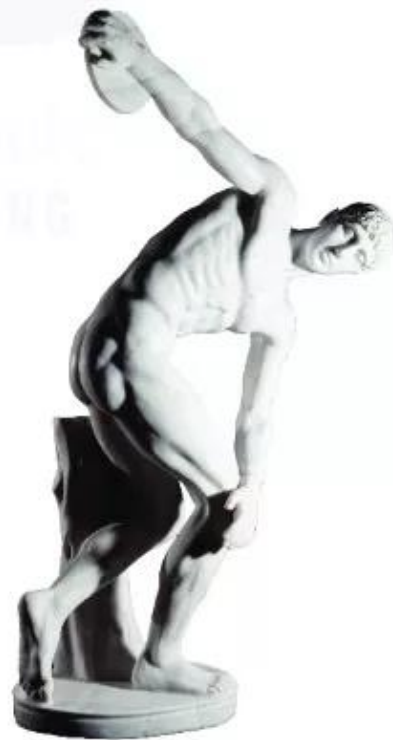
▲ Hình 11. Tượng Lược sĩ ném đĩa bằng đá cẩm thạch trắng