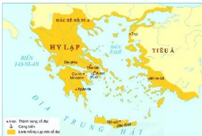
▲ Hình 2. Lược đồ Hy Lạp thời cổ đại