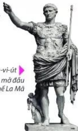
Hình 7. Ốc-ta-vi-út (63 TCN – 14), người mở đầu thời kì đế chế La Mã

Từ một thành bang nhỏ bé ở miền Trung bán đảo I-ta-li-a, Nhà nước La Mã đã dần mở rộng lãnh thổ, trở thành đế chế rộng lớn vào thế kỉ I TCN. Năm 27 TCN, Ốc-ta-vi-út được tôn lên thành Đấng tối cao, có quyền lực như hoàng đế, mở đầu thời kì đế chế.