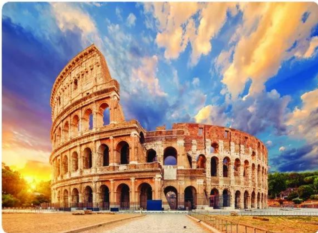
▲ Hình 12. Đấu trường Cô-li-dê (La Mã)

Người Hy Lạp và La Mã cổ đại đã xây dựng những công trình kiến trúc nổi tiếng. Trong đó, nhiều công trình còn được bảo tồn đến ngày nay.