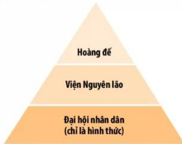
▲ Hình 8. Sơ đồ tổ chức Nhà nước đế chế ở La Mã

❓ Dựa vào sơ đồ trên, hãy trình bày tổ chức nhà nước đế chế ở La Mã.