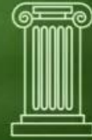
▲ Hình 10. Bảng chữ số La Mã