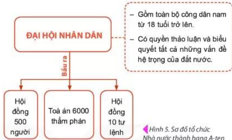
◀ Hình 5. Sơ đồ tổ chức Nhà nước thành bang A-ten

A-ten là thành bang quan trọng nhất, tiêu biểu cho chế độ dân chủ ở Hy Lạp cổ đại. Để bảo vệ nền dân chủ và ngăn chặn những âm mưu đảo chính, “chế độ bỏ phiếu bằng vô sò” đã được thực hiện. Đến thế kỉ I TCN, Hy Lạp bị đế quốc La Mã thôn tính.