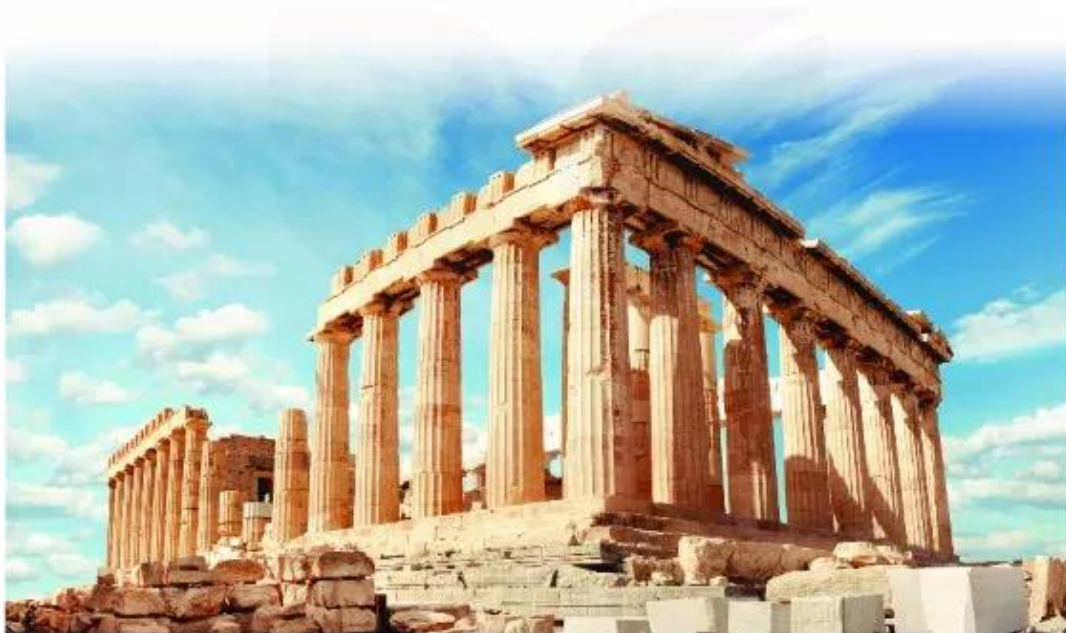
▲ Hình 1. Đền Pác-tê-nông – thành tựu nổi bật của văn minh Hy Lạp cổ đại

Không có cơ sở của văn minh Hy Lạp và La Mã thì không có châu Âu hiện đại (theo Ăng-ghe-n). Theo em, điều gì khiến cho nền văn minh cổ đại này được đánh giá cao như vậy? Văn minh Hy Lạp và La Mã thời cổ đại có điểm gì nổi bật?