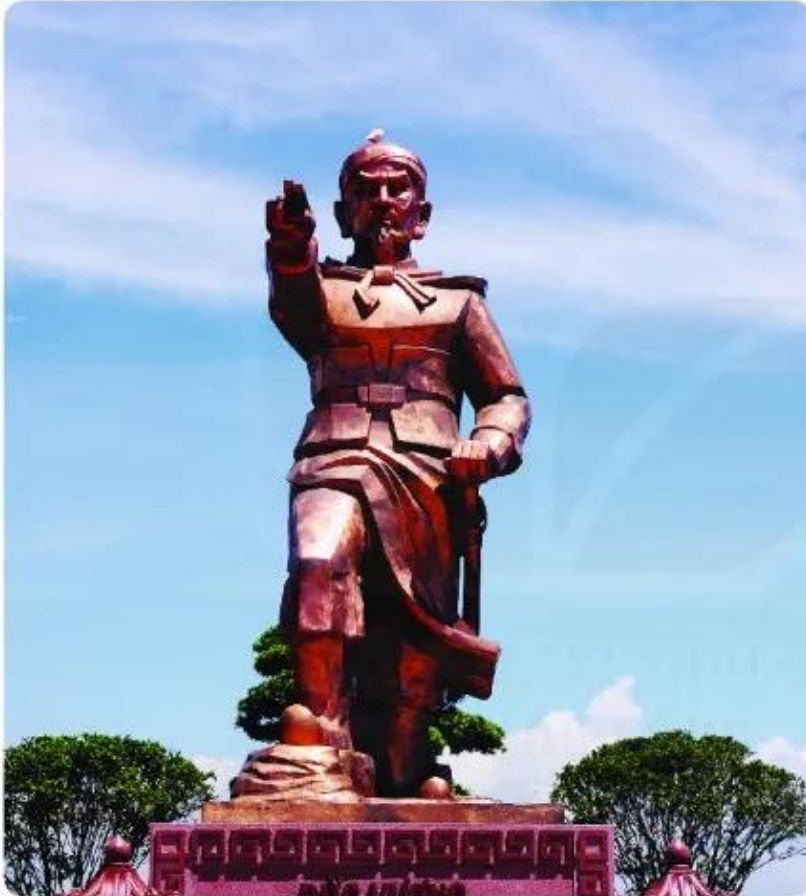
▲ Hình 4. Tượng Ngô Quyền (Hải Phòng)

Trước vận nước lâm nguy, Ngô Quyền đã gấp rút chuẩn bị kế hoạch đối phó với quân Nam Hán. Vùng cửa sông Bạch Đằng được lựa chọn để bố trí trận địa đánh giặc.