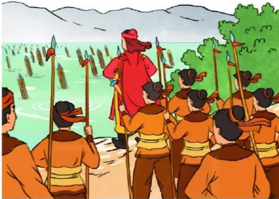
▲ Hình 5. Mô phỏng trận địa cọc trên sông Bạch Đằng (tranh minh họa)