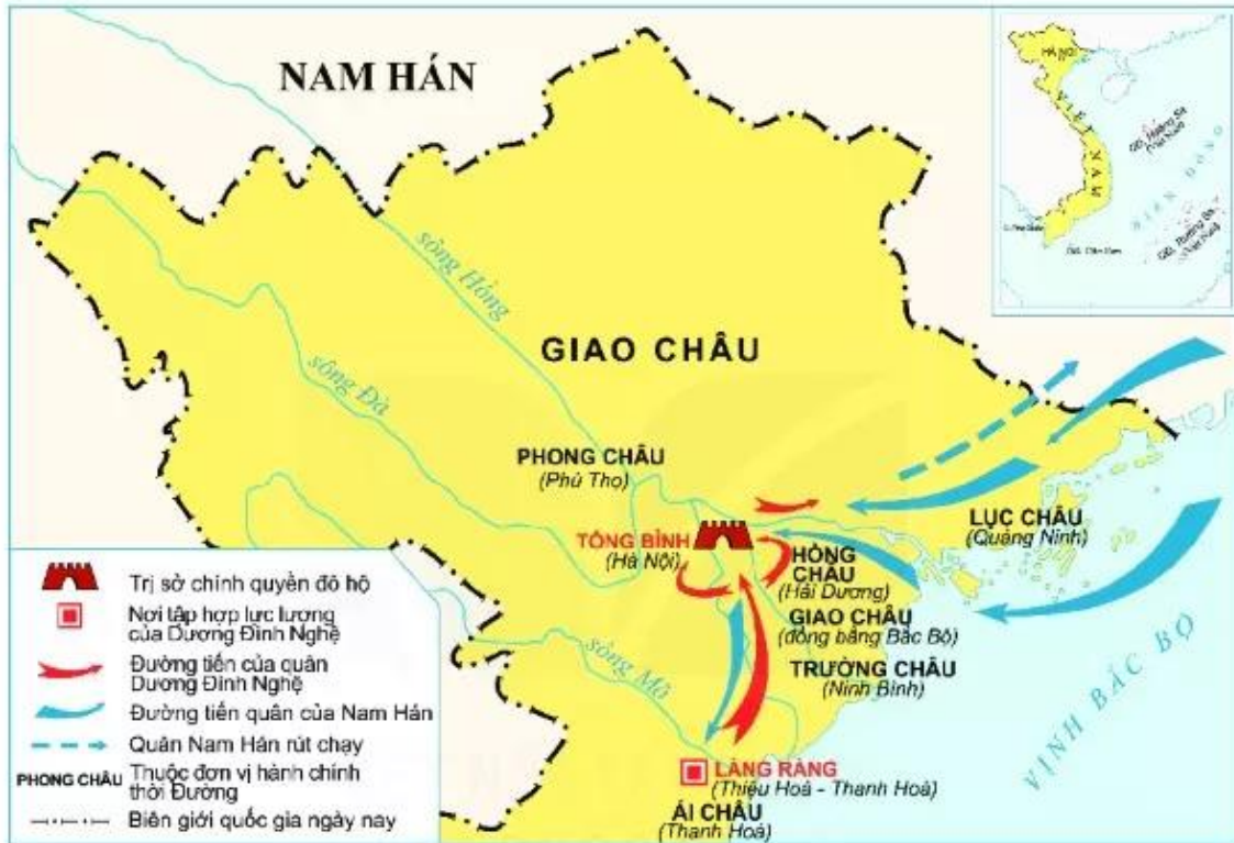
▲ Hình 3. Lược đồ cuộc kháng chiến chống quân Nam Hán lần thứ nhất (930 – 931)

Năm 931, thuộc tướng cũ của họ Khúc là Dương Đình Nghệ kéo quân từ Thanh Hoá ra Bắc đánh đuổi quân Nam Hán.