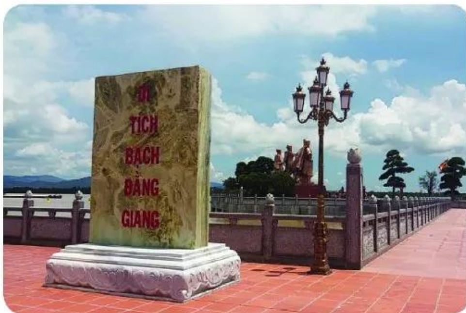
▲ Hình 7. Di tích Bạch Đằng Giang (Hải Phòng)