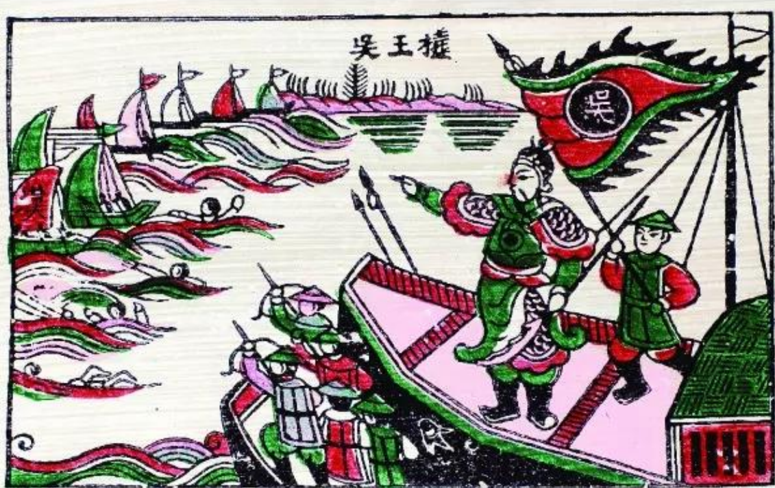
▲ Hình 1. Bạch Đằng dậy sóng (tranh dân gian Đông Hồ)

Mùa xuân năm 40, lịch sử từng vang lên lời thề bất hủ của Hai Bà Trưng: “Một xin rửa sạch nước thù; Hai xin đem lại nghiệp xưa họ Hùng”. Nhưng trong khoảng gần 900 năm, từ Hai Bà Trưng, Bà Triệu đến Lý Bí, Mai Thúc Loan,... đều chưa thực hiện được trọn vẹn lời thề. Cuối cùng, ai là người đã hoàn thành trọn vẹn được ước nguyện độc lập thiêng liêng ấy và thực hiện thông qua sự kiện nào?