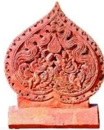
▲ Hình 3. Ngõi úp trang trí đời chim phượng bằng đất nung tìm thấy ở Hoàng thành Thăng Long

? Thế nào là tư liệu hiện vật? Từ hình 2 và 3, em hãy kể thêm một số tư liệu hiện vật mà em biết.