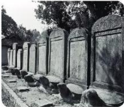
▲ Hình 4. Những tấm bia ghi tên người đỗ Tiến sĩ thời xưa ở Văn Miếu (Hà Nội)

Những bản ghi, tài liệu chép tay hay sách được in, khắc chữ được gọi chung là tư liệu chữ viết . Các nguồn tư liệu này "kể" lại cho ta biết tương đối đầy đủ về các mặt của đời sống con người. Tuy nhiên, tư liệu chữ viết thường mang ý thức chủ quan của tác giả tư liệu.