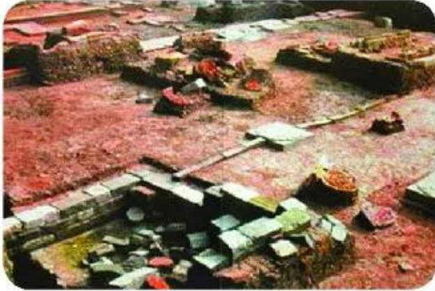
▲ Hình 2. Nhóm hiện vật lợp mái cung điện thời Lý được tìm thấy tại Khu di tích Hoàng thành Thăng Long

Tư liệu hiện vật là những di tích, đồ vật,... của người xưa còn lưu giữ lại trong lòng đất hay trên mặt đất. Tuy đây chỉ là những hiện vật "câm", nhưng nếu biết khai thác, chúng có thể "nói" cho ta biết khá cụ thể và trung thực về đời sống vật chất và phần nào đời sống tinh thần của người xưa.