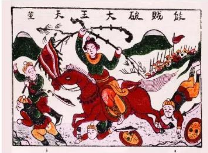
Hình 5. Thánh Gióng đánh giặc Ân (tranh dân gian Đông Hồ)

Những câu chuyện dân gian, truyền thuyết được kể truyền miệng từ đời này qua đời khác gọi là tư liệu truyền miệng . Loại tư liệu này thường không cho biết chính xác về thời gian và địa điểm, nhưng phần nào phản ánh hiện thực lịch sử.