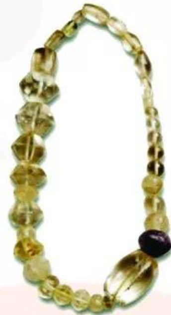
b. Chuỗi hạt

▲ Hình 1. Một số hiện vật khai quật được ở vùng đất Nam Bộ, thuộc văn hoá Óc Eo (thế kỉ I – VII)