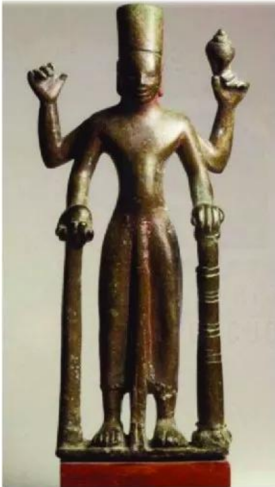
▲ Hình 6. Tượng thần Vis-nu – một trong ba vị thần quan trọng của Ấn Độ giáo – được tìm thấy ở Nam Bộ

Để phục vụ cho việc thờ cúng, nghề tạc tượng các vị thần Ấn Độ giáo và tượng Phật bằng đá và gỗ ở Phù Nam đã khá phát triển từ đầu Công nguyên, tạo nên một phong cách riêng – phong cách Phù Nam.