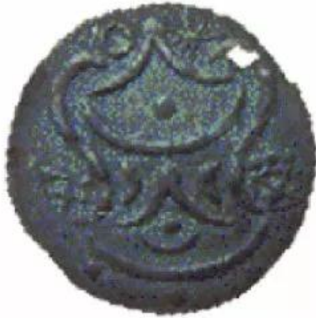
▲ Hình 4. Đồng tiền kim loại của Phù Nam được tìm thấy ở di chỉ văn hoá Óc Eo

Đặc biệt, người Phù Nam rất giỏi nghề buôn bán. Không chỉ trao đổi hàng hoá để tiêu dùng trong nước, người Phù Nam còn buôn bán với các thương nhân nước ngoài đến từ Trung Quốc, Chăm-pa, Mã Lai, Ấn Độ,... thông qua các cảng thị, tiêu biểu là Óc Eo.