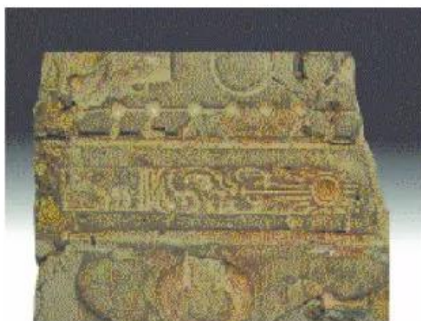
▲ Hình 3. Khuôn đúc bằng đá