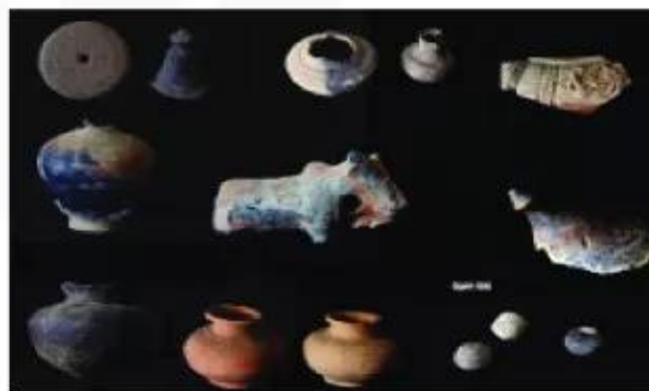
▲ Hình 2. Một số sản phẩm đồ gốm của cư dân Phù Nam