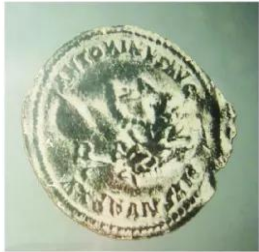
▲ Hình 5. Huy chương La Mã được tìm thấy ở di chỉ Nền Chùa (Kiên Giang)

Sử kí Trung Quốc chép về Vương quốc Phù Nam như sau: “Dân Phù Nam mưu lược, nhưng tốt bụng và thật thà, chuyên nghề buôn bán... Hàng hoá bán thường ngày là vàng, bạc, lụa,...”.