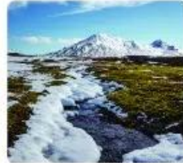
d) Đài nguyên ở vùng cực