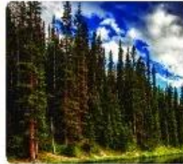
c) Rừng lá kim ở châu Âu