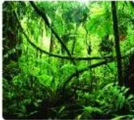
a) Rừng mưa nhiệt đới ở Trung Mỹ

Ở đới nóng có rừng mưa nhiệt đới, rừng nhiệt đới gió mùa, xa van,... Ở đới ôn hoà có rừng lá rộng, rừng lá kim, thảo nguyên, rừng cận nhiệt đới,... Ở đới lạnh có thảm thực vật đài nguyên.