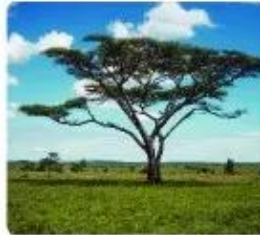
b) Xa van ở châu Phi