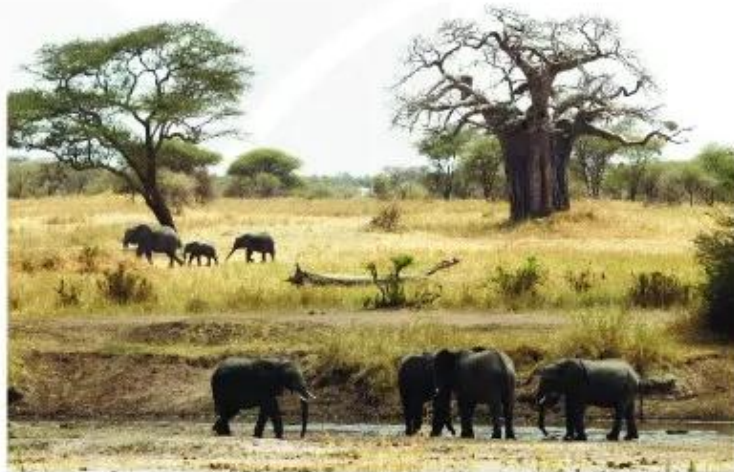
Hình 1. Xa van ở Tan-da-ni-a (Châu Phi)

Là nơi có nhiệt độ cao. Cảnh quan thiên nhiên thay đổi chủ yếu phụ thuộc vào chế độ mưa. Giới thực, động vật hết sức đa dạng phong phú.