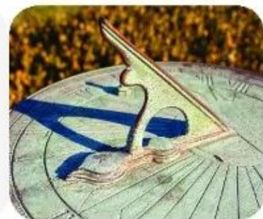
c. Đồng hồ mặt trời