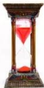
a. Đồng hồ cát

Để đo đếm được thời gian, ta cần biết cách tính. Từ xa xưa, các dân tộc đã sáng tạo ra nhiều cách đo thời gian khác nhau.