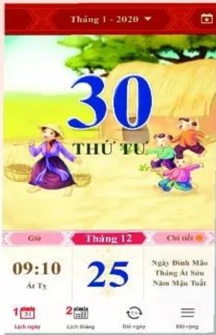
Hình 1. Một tờ lịch treo tường ▲