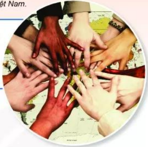
Hình 1. Ba chủng tộc trên thế giới với những màu da khác nhau (minh hoạ) ▶

Các em có biết tại sao người châu Phi có làn da đen, người châu Á da vàng, còn người châu Âu da lại trắng? Liệu họ có cùng chung một nguồn gốc hay không? Nếu có thì từ đâu mà ra?