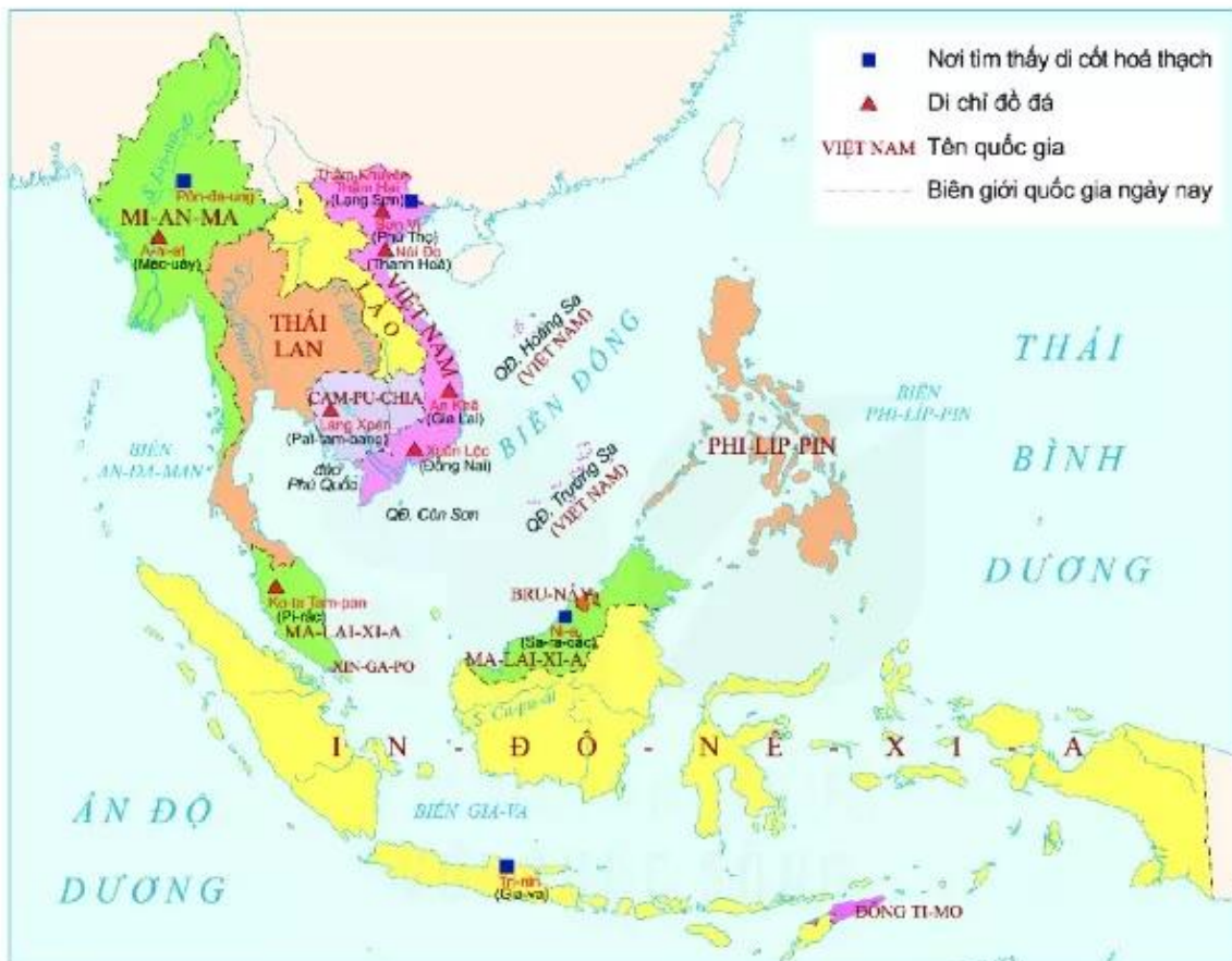
▲ Hình 3. Lược đồ dấu tích của Người tối cổ ở Đông Nam Á

Tại khu vực Đông Nam Á đã diễn ra quá trình tiến hoá từ vượn thành người từ rất sớm. Dấu tích của Người tối cổ đã được tìm thấy ở khắp Đông Nam Á và cả Việt Nam. Đó là những di cốt hoá thạch và công cụ đá do con người chế tạo ra.