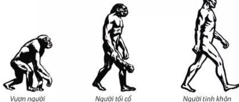
▶ Hình 2. Các dạng người trong quá trình tiến hoá

Quá trình tiến hoá từ vượn thành người đã diễn ra cách đây hàng triệu năm. Ở chặng đầu của quá trình đó, cách ngày nay khoảng 5 – 6 triệu năm, đã có một loài Vượn người sinh sống. Từ loài Vượn người, một nhánh đã phát triển lên thành Người tối cổ. Dạng người này xuất hiện khoảng 4 triệu năm trước, đến khoảng 15 vạn năm thì biến đổi thành Người tinh khôn.