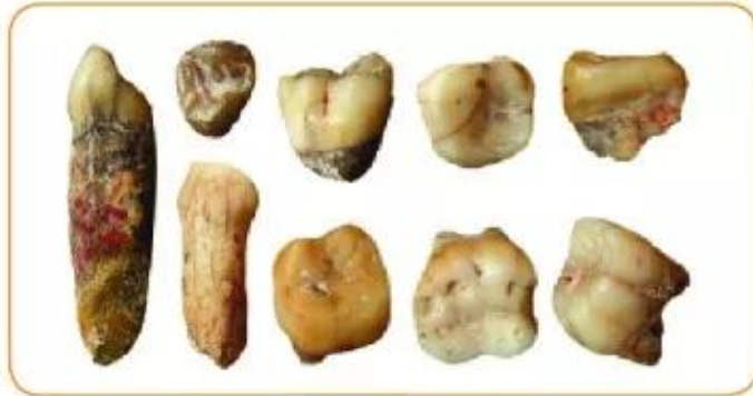
▲ Hình 5. Răng hoá thạch của Người tối cổ được tìm thấy ở hang Thẩm Khuyên