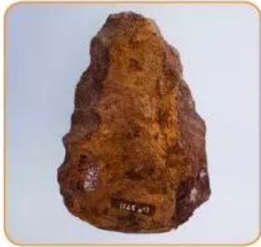
▲ Hình 4. Công cụ đá Núi Đọ