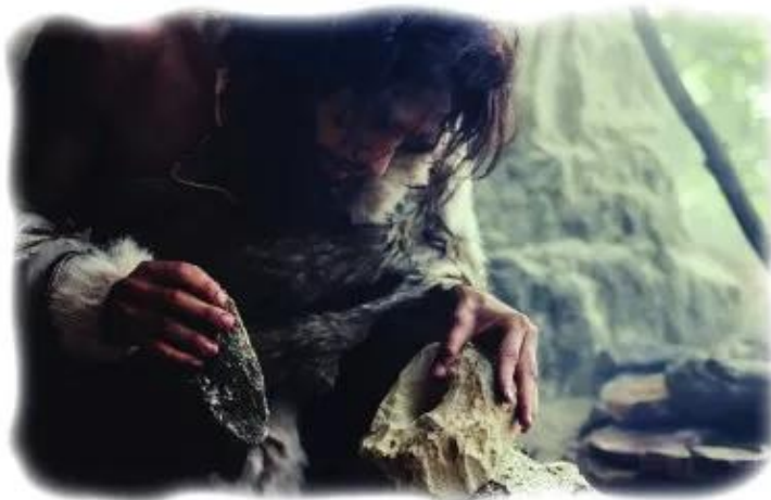
◀ Hình 2. Hình ảnh thực nghiệm cách chế tạo công cụ đá của người nguyên thủy

Trong quá trình lao động, tìm kiếm thức ăn, đôi bàn tay của người nguyên thủy dần trở nên khéo léo hơn, cơ thể cũng dần biến đổi để trở thành Người hiện đại. Nhờ có lao động, con người đã từng bước tự cải biến, hoàn thiện mình và làm cho đời sống ngày càng phong phú hơn.