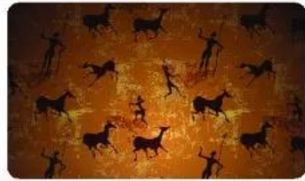
▲ Hình 1. Bức tranh của người nguyên thủy vẽ cảnh đi săn

Có một bức tranh được cho là của người nguyên thủy vẽ cảnh đi săn trên vách hang Lôt Ca-ba-lôt (Tây Ban Nha), với niên đại khoảng 10 000 năm trước. Một số người cho rằng người nguyên thủy sống như những bầy động vật hoang dã, lang thang trong các khu rừng rậm, không có tổ chức, ăn sống nuốt tươi, ... Liệu trong thực tế có đúng như vậy không?