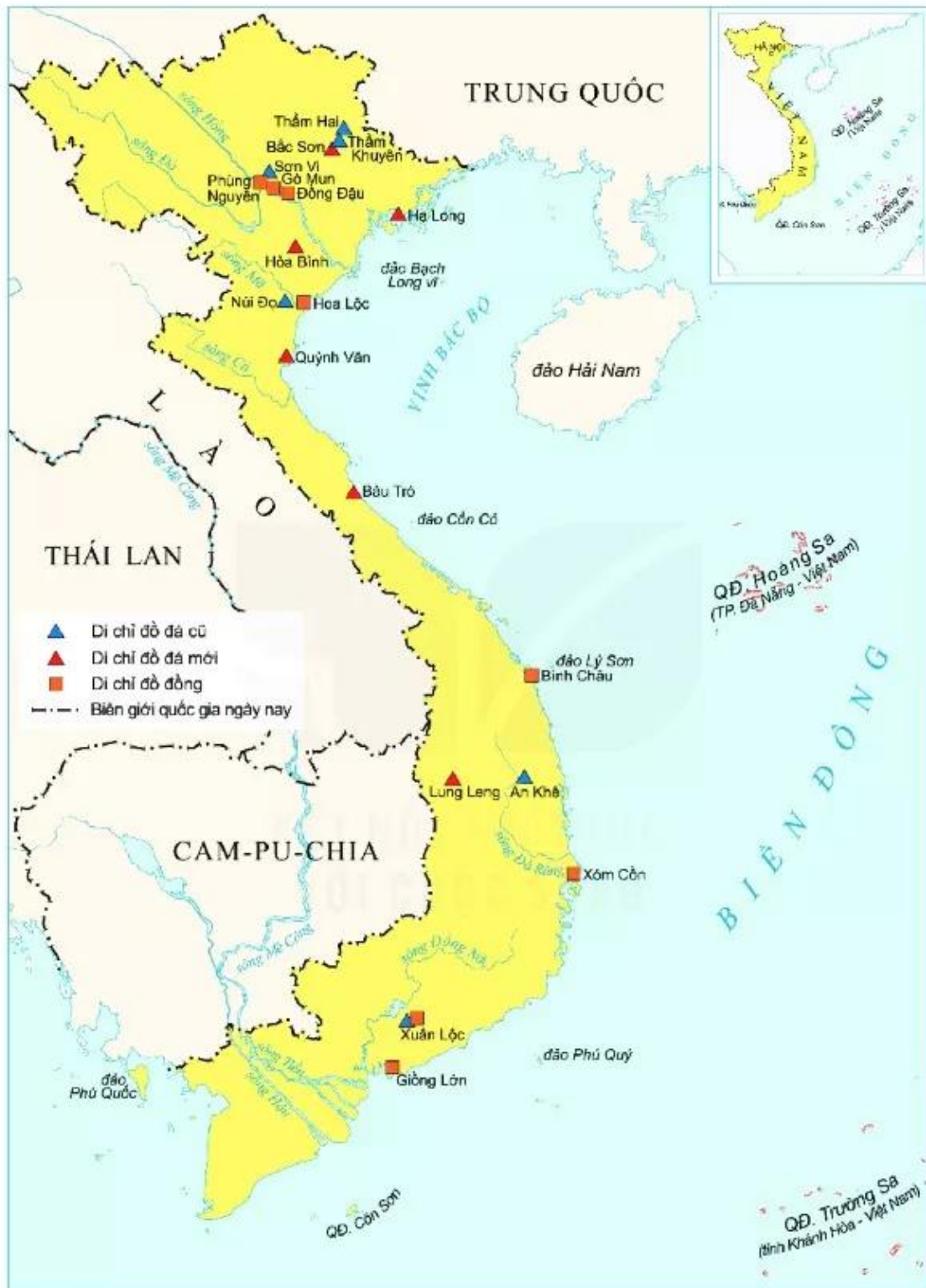
▲ Hình 4. Lược đồ di chỉ thời đồ đá và đồng ở Việt Nam