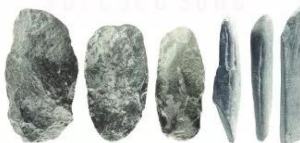
▲ Hình 3. Rìu mài lưỡi Bắc Sơn

Ở Việt Nam, người nguyên thủy cũng đã từng bước tìm cách cải tiến công cụ. Từ chỗ chỉ biết ghè đẽo, họ đã biết mài đá, tạo ra nhiều loại công cụ khác nhau như rìu, bôn, chày, cuốc đá. Tre, gỗ, xương, sừng cũng được sử dụng để làm mũi tên, mũi lao. Đồ gốm đã dần phổ biến với nhiều kiểu dáng khác nhau, hoa văn trang trí phong phú.