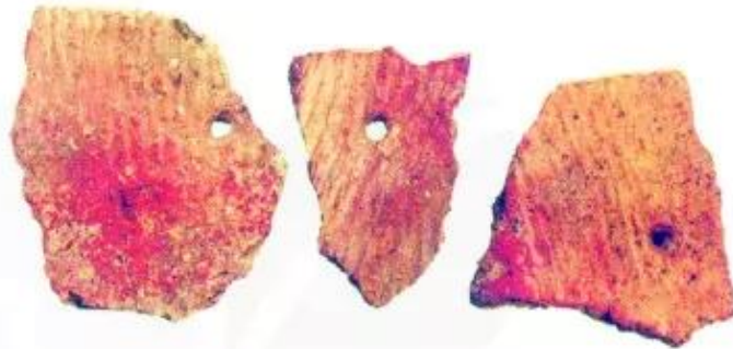
▲ Hình 6. Gốm Quỳnh Văn

Văn hoá Quỳnh Văn tập trung chủ yếu ở vùng ven biển Quỳnh Lưu (Nghệ An). Người Quỳnh Văn có nghề làm gốm rất phát triển với hoa văn chải và nan rá rất đặc trưng.