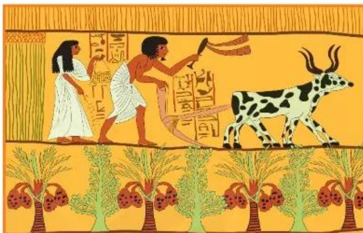
▲ Hình 4. Người Ai Cập cổ đại canh tác nông nghiệp (tranh vẽ)

Nhờ biết khai thác những thuận lợi của điều kiện tự nhiên, cư dân Ai Cập, Lưỡng Hà đã sớm tạo dựng được nền văn minh của mình.