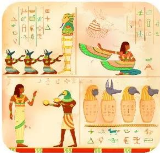
▲ Hình 1. Chữ viết trên giấy Pa-pi-rut của người Ai Cập