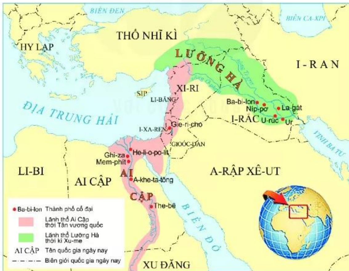
▲ Hình 3. Lược đồ Ai Cập và Luống Hà cổ đại

(Theo Lương Ninh (Chủ biên), Lịch sử thế giới cổ đại , NXB Giáo dục Việt Nam, Hà Nội, 2015, tr.34, 63)