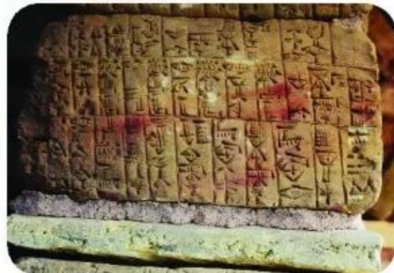
▲ Hình 2. Chữ viết hình nêm trên đất sét của người Lương Hà

Dưới đây là những hình ảnh mô tả chữ viết của người Ai Cập và Lương Hà cổ đại. Em có biết người Ai Cập, Lương Hà đã sáng tạo ra loại chữ viết này thế nào không? Họ đã xây dựng nền văn minh của mình trong điều kiện ra sao?