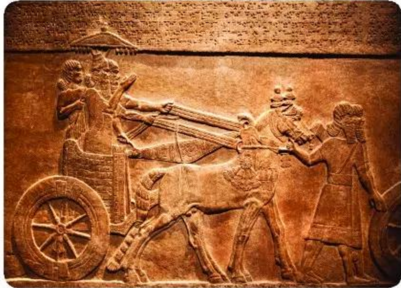
▲ Hình 5. Một bức điêu khắc của người Lưỡng Hà miêu tả việc sử dụng bánh xe

Người Ai Cập đã dùng thân cây Pa-pi-rut để tạo ra giấy. Từ “paper” (giấy viết trong tiếng Anh) có gốc từ “Papyrus”. Người Lưỡng Hà dùng những vật nhọn có hình tam giác làm “bút” rồi viết lên tấm đất sét ướt, tạo thành chữ giống hình cái nêm nên gọi là chữ hình nêm.