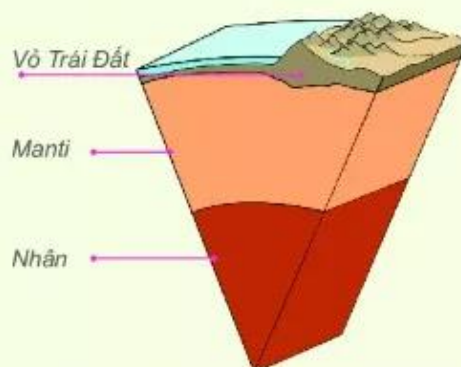
Hình 1. Lát cắt về cấu tạo Trái Đất