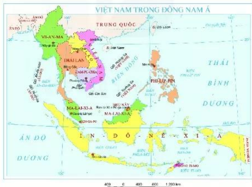
Hình 3. Bản đồ Việt Nam trong Đông Nam Á