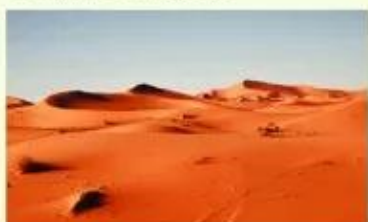
Hình 6. Sa mạc Xa-ha-ra ở châu Phi là sa mạc lớn nhất thế giới với diện tích hơn 9 triệu km 2