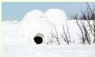
Hình 4. Ngôi nhà làm bằng băng của người E-xki-mô ở A-la-xca (Hoa Kỳ) để chống lại cái lạnh ở vùng cực

Muốn học Địa lí đạt hiệu quả cao, các em cần phải có hứng thú trong học tập.