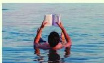
Hình 7. Biển Chết nằm ở ranh giới của ba quốc gia Gióc-đan, Pa-le-xin, I-xra-en, nước ở đây có độ muối cao đến mức không có loài cá nào có thể sinh sống và cơ thể người tự nổi lên mặt nước