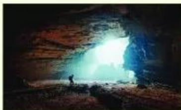
Hình 5. Hang Sơn Đoòng (Việt Nam) là một trong những hang động đá vôi lớn nhất thế giới